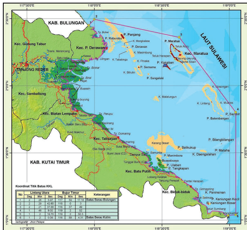
Gambar Peta Kabupaten Berau