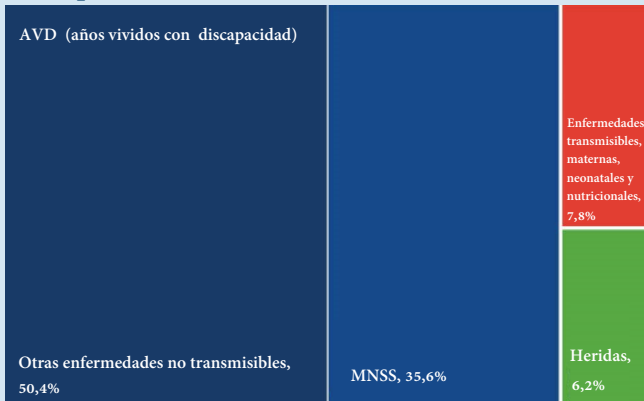
Figura 1. Distribución de AVD con un enfoque en trastornos mentales, neurológicos, de consumo de sustancias y autolesiones (MNSS)

Los trastornos mentales, neurológicos, por consumo de sustancias y el suicidio (MNSS) causan el 19% de todos los años de vida ajustados por discapacidad (AVAD) y el 36% de todos los años vividos con discapacidad (AVD).