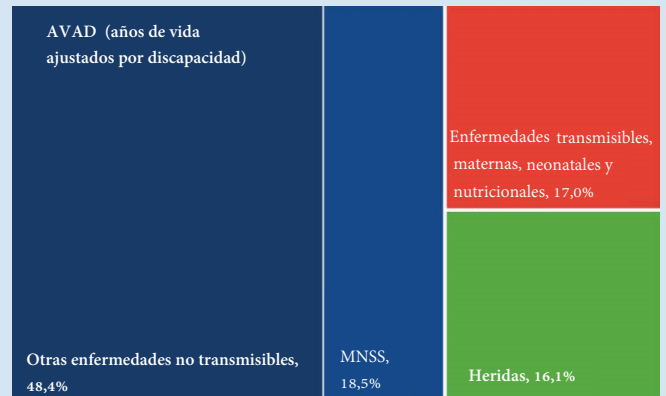
Figura 2. Distribución de AVAD con un enfoque en trastornos mentales, neurológicos, de consumo de sustancias y autolesiones (MNSS)