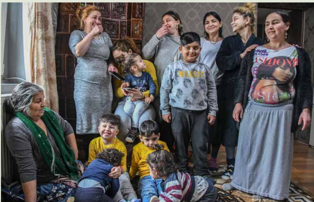
Una gran familia gitana: matriarca con sus hijas, nueras y nietos.

La estrategia de la Comisión Europea Una unión de la igualdad: Marco estratégico de la UE para la igualdad, la inclusión y la participación de los gitanos afirma que muchas de las entre 10 y 12 millones de personas de la comunidad romaní del continente europeo (según estimaciones de 2012) siguen enfrentándose a la discriminación. La estrategia se centra en la diversidad de la población romaní para garantizar que las estrategias nacionales satisfagan las necesidades de los distintos grupos, como las mujeres romaníes, los jóvenes, los niños, los ciudadanos móviles de la UE, los apátridas y los gitanos de edad avanzada, así como las personas con discapacidad. La estrategia fomenta un enfoque interseccional, teniendo en cuenta cómo pueden combinarse diferentes aspectos de la identidad para exacerbar la discriminación. También incluye un marco de medición con objetivos e indicadores que se corresponden con los ODS. Entre ellos se incluye la medición del acceso a la atención de salud para los romaníes y las diferencias en los resultados de salud entre las poblaciones romaníes y no romaníes (204).