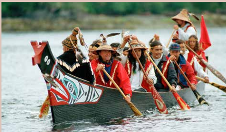
Canoa de la Nación Squamish acercándose a Bella Bella (Canadá) 1993, Año Internacional de las Poblaciones Indígenas del Mundo

En junio de 2021, entró en vigor la Ley de la Declaración de las Naciones Unidas sobre los Derechos de los Pueblos Indígenas como ley federal en el Canadá. Esta ley exige que la legislación nacional sea coherente con la Declaración de las Naciones Unidas sobre los derechos de los pueblos indígenas y exhorta a que se tomen medidas concretas para alcanzar los objetivos y supervisar los progresos de la Declaración. También incluye medidas para hacer frente a las injusticias, combatir los prejuicios y eliminar todas las formas de violencia, racismo y discriminación contra los pueblos indígenas, y promover el respeto y el entendimiento mutuos (107).