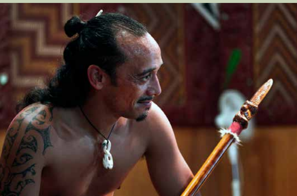
Cultura maorí (Nueva Zelanda).

para planificar programas y políticas para hacer frente a las desigualdades sanitarias (11). En 2019, se puso en marcha la iniciativa Wh nau Ora como enfoque transgubernamental, culturalmente fundamentado y basado en la familia para los servicios de salud y el fomento de la capacidad de acción y decisión de las comunidades (95). Como resultado de estos esfuerzos, Nueva Zelanda ha avanzado en la reducción de las desigualdades sanitarias étnicas en los últimos decenios (96).