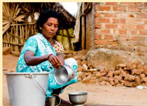
Mujer de una comunidad tribal.

En la India viven más de 104 millones de pueblos indígenas tribales cuyos indicadores de salud están por debajo de la media nacional. En un artículo de revisión de 2013 se examinó la prestación de los sistemas de salud de la India para las poblaciones tribales, destacando el marco nacional y la hoja de ruta del Gobierno de la India para mejorar los servicios de salud para los pueblos tribales. La reforma del sistema de salud local se ha centrado en los centros de salud y bienestar tribales y en nuevos acuerdos de gobernanza. Los servicios de salud contratan personal local de las zonas tribales, se ha ampliado la formación del personal y se han incorporado curanderos tradicionales a los servicios. Esta reforma se ha visto facilitada por nuevos mecanismos de financiación que incluyen mecanismos flexibles de contratación, el fomento de las alianzas público-privadas y la financiación de actividades de responsabilidad social empresarial (184).