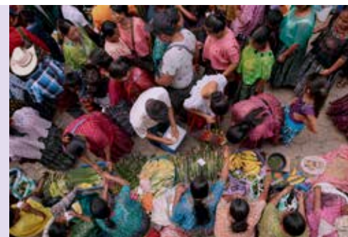
Guatemala: mujeres de zonas rurales diversificando sus ingresos y desarrollando resiliencia.

El Foro Internacional de Mujeres Indígenas es una red mundial que permite a las organizaciones de mujeres indígenas de todo el mundo fortalecer sus capacidades y adquirir técnicas de liderazgo, así como garantizar la participación de las mujeres en la investigación y los procesos de toma de decisiones. Un ejemplo de su trabajo es el Observatorio de Mujeres Indígenas contra la Violencia, creado en 2010, que es un mecanismo para supervisar y sacar a la luz la situación de la violencia contra las mujeres indígenas, como respuesta a la falta de datos e información pertinentes. También tiene como objetivo garantizar un enfoque participativo e interactivo en los estudios de investigación y la documentación de los casos a nivel local (199).