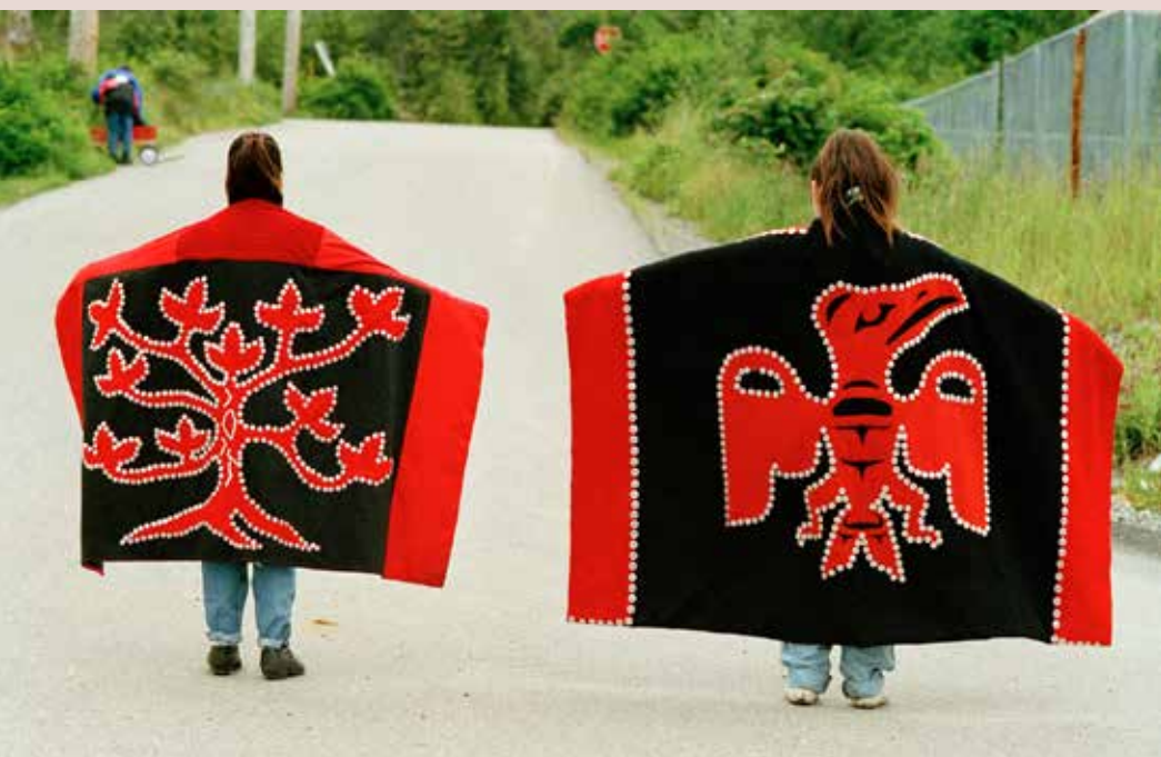
Dos miembros de la Nación Quileute mostrando los intrincados patrones de sus mantas de botones, durante el Festival Qatuwas de las naciones indígenas de la Cuenca del Pacífico. Bella Bella (Canadá). 1993, Año Internacional de las Poblaciones Indígenas del Mundo.

Desde 2003, la Facultad de Medicina del Norte de Ontario ofrece ejemplos de descolonización de la enseñanza de la medicina, centrándose en la participación comunitaria (mecanismo estratégico 4) de los pueblos indígenas locales. Además de reservar plazas para los solicitantes indígenas, el curso incluye módulos sobre salud indígena como parte del plan de estudios básico (167). Todos los estudiantes de medicina realizan un programa de residencia de un mes viviendo y trabajando en comunidades indígenas, y existe la opción de especializarse en salud indígena. Existen métodos de enseñanza a distancia, que pueden ser importantes para los estudiantes de origen indígena. Por último, la facultad de medicina promueve una amplia gama de actividades periféricas relacionadas con la defensa y la salud pública de las comunidades indígenas, como los círculos de intercambio de conocimientos, los grupos de interés cultural y los programas de creación de redes y tutoría (168).