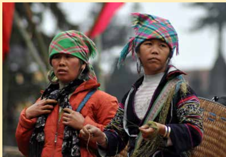
Mujeres de la minoría Hmong vestidas con ropa tradicional. Sa Pa (Vietnam).