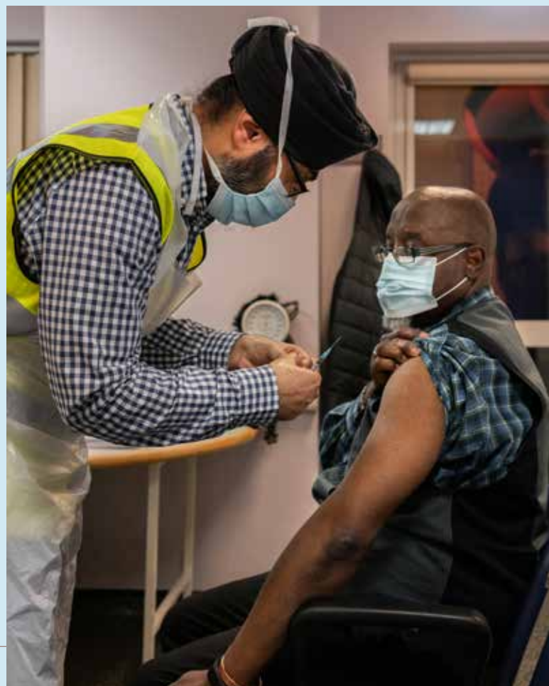
Reino Unido: Vacunación contra la COVID-19.