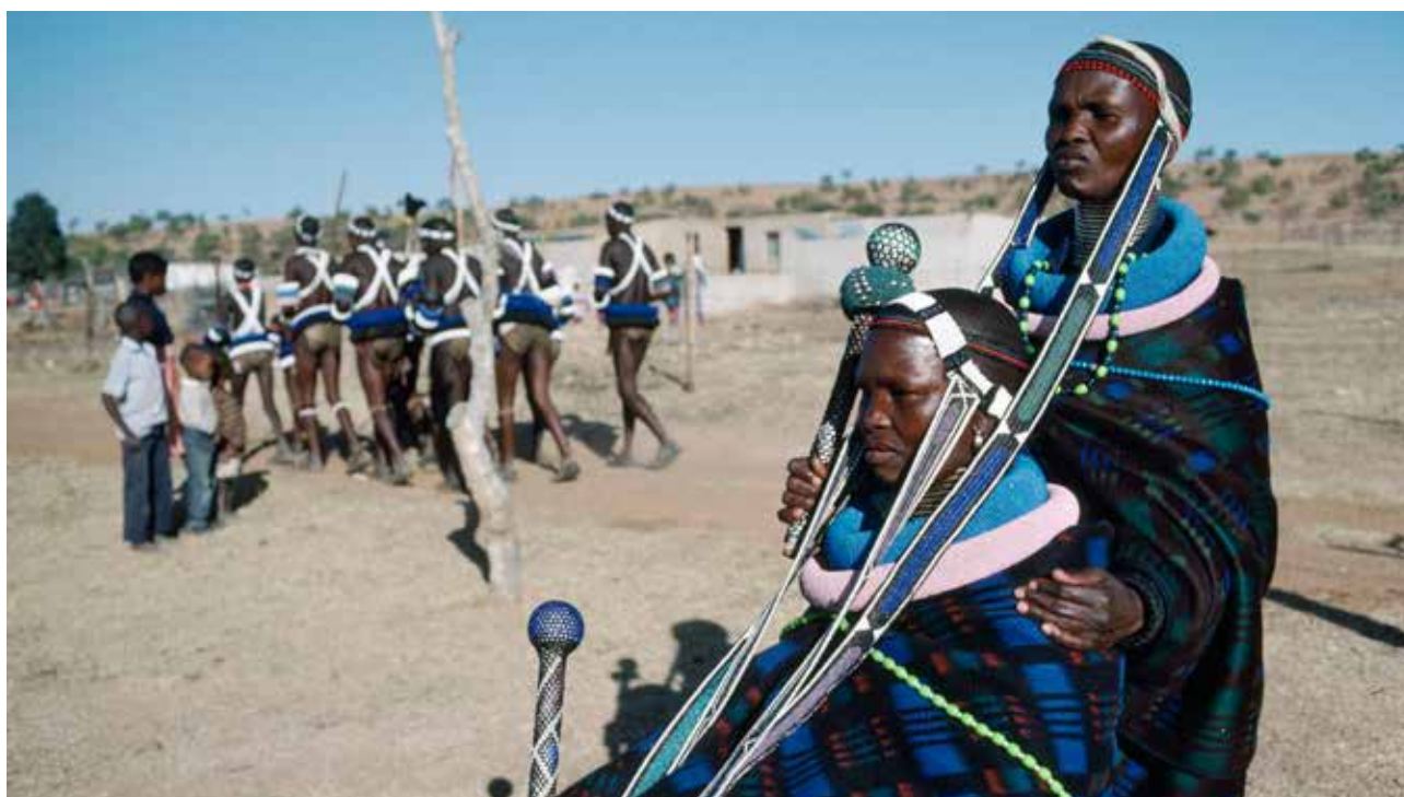
Tribu ndebele (Sudáfrica).

Dos madres de la tribu ndebele esperan a que sus hijos empiecen a desfilarse y bailar tras su ceremonia de iniciación.