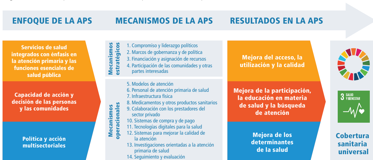
Figura 1. Marco operacional de la OMS para la atención primaria de salud

El marco operacional de la OMS para la atención primaria de salud (figura 1) muestra los vínculos entre la atención primaria de salud y la mejora de la salud, la equidad, la seguridad sanitaria y la costoeficacia. Se describen catorce mecanismos estratégicos y operacionales como posibles áreas de acción para que las instancias normativas fortalezcan la atención primaria de salud (38).