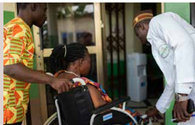
Medicina tradicional y cobertura sanitaria universal en Ghana.

En un comentario en que se reflexiona sobre el proceso de realización de estudios participativos con base comunitaria en Ghana (entre 2015 y 2017) se señalan cuestiones ético-culturales clave a la hora de utilizar este enfoque de investigación. Según el estudio, es necesario establecer relaciones y confianza, promover la confidencialidad, garantizar el consentimiento informado y respetar los valores y las prácticas culturales para salvaguardar la integridad de la investigación. Además, se señala la aplicación de medidas para reducir las barreras a la participación, como el diseño de las sesiones de intervención para que resulten factibles, interactivas y se impartan en la lengua materna de los participantes (198).