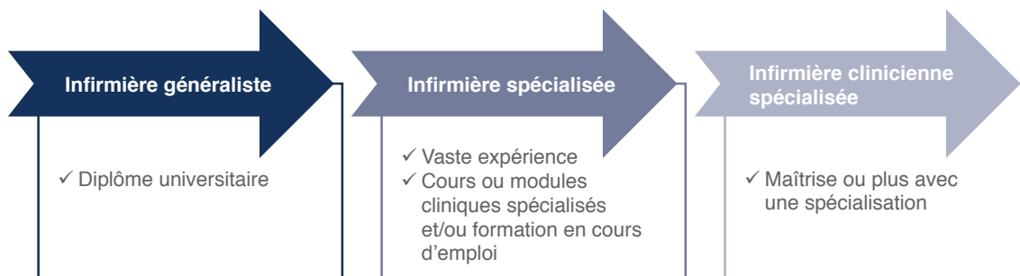
Figure 1 : progression d’infirmière généraliste à infirmière clinicienne spécialisée

La figure 1 décrit la progression d’infirmière généraliste à ICS, en suivant un programme de master propre à l’ICS. Cette progression permet de reconnaître les fondements de l’expertise clinique spécialisée sur la base d’une formation d’infirmière généraliste. Une infirmière généraliste peut directement intégrer un programme d’ICS si elle satisfait les critères nationaux et universitaires de formation à l’ICS. L’obtention d’un master au minimum confère une plus grande crédibilité professionnelle et clinique à l’infirmière, qui progresse ainsi pour obtenir le titre d’ICS. La formation supplémentaire et l’expertise clinique acquises grâce à un diplôme