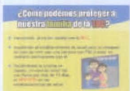
Lámina N° 13:

¿CÓMO PODEMOS PROTEGER A NUESTRA FAMILIA DE LA TBC?