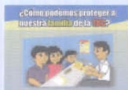
Lámina N° 12:

¿CÓMO PODEMOS PROTEGER A NUESTRA FAMILIA DE LA TBC? (Titulo)