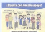
Lámina N° 16:

A no ser rechazadas o rechazados por tener tuberculosis así como cualquier otra enfermedad.