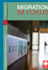
Migration im Fokus Dezember 2019: Abschiebung und Abschiebungshaft

In der Reihe „Migration im Fokus“, die die Reihe „Fluchtpunkte“ ersetzt, sind bereits erschienen: