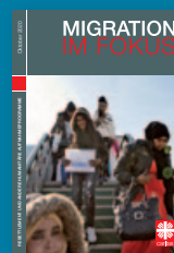
Migration im Fokus Oktober 2020: Resettlement und andere humanitäre Aufnahmeprogramme