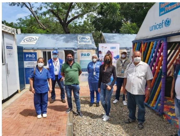
Espacio de Apoyo Puente Francisco de Paula Santander.

Se dio apertura de un corredor humanitario de alimentación escolar en coordinación con la Gobernación de Norte de Santander, para atender a los niños y niñas que hacen parte del Programa de Alimentación Escolar y a otros estudiantes refugiados y migrantes.