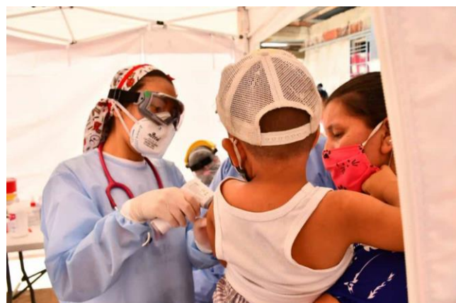
Atención primaria en salud para población refugiada y migrante afectada por la ola invernal en el barrio 23 de enero, Cúcuta

Dotación de insumos y equipos para el fortalecimiento de establecimientos de salud como el Instituto Departamental de Salud, 4.821 refugiados y migrantes beneficiados de consultas de atención primaria en salud y jornadas de información, educación y comunicación en salud para 1.655 personas.