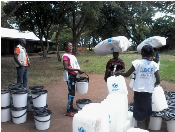
© Ephraïm SELGUETIA Adjoint Programme Manager, ACF Des journalières et bénéficiaires au point de distribution