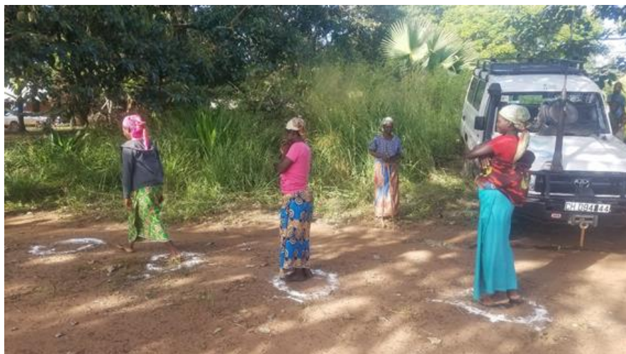
Des bénéficiaires en attente de leurs kits à Bohong