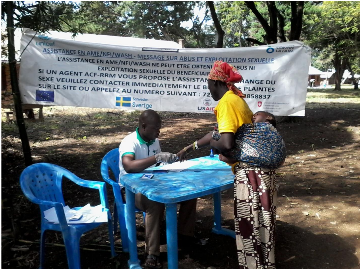
© Ephraïm SELGUETIA Adjoint Programme Manager Intervention RRM pour Action contre la Faim Une femme récipiendaire à la table d'émargement

Préfecture : Ouham-Péndé Sous-Préfecture : Bocaranga Commune : Bocaranga Localité : Bohong Axe : Bouar-Bohong-Bocaranga Référence de l'alerte RRM : ACF_BOH_ 20200915