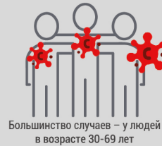
Большинство случаев – у людей в возрасте 30-69 лет

Эпидемиологический анализ ВОЗ и Центров по контролю и профилактике заболеваний показал, что представители уязвимых групп, в том числе пожилые люди, люди с хроническими заболеваниями и люди с ослабленным иммунитетом (люди с заболеваниями сердца, диабетом и респираторными заболеваниями) в наибольшей степени подвержены риску смерти от COVID-19; данные группы населения должны быть в центре ответных усилий.