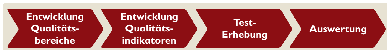
Abbildung 1: Vorgehen in der Entwicklung des „Unterbringungs-TÜV“

Die folgenden Unterkapitel beschreiben die vier Schritte in der Entwicklung des „Unterbringungs-TÜV“.