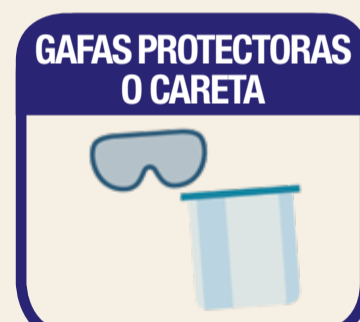
GAFAS PROTECTORAS O CARETA

Botas de goma estándar que se puedan desinfectar después de usarse o cobertores de calzado desechables.