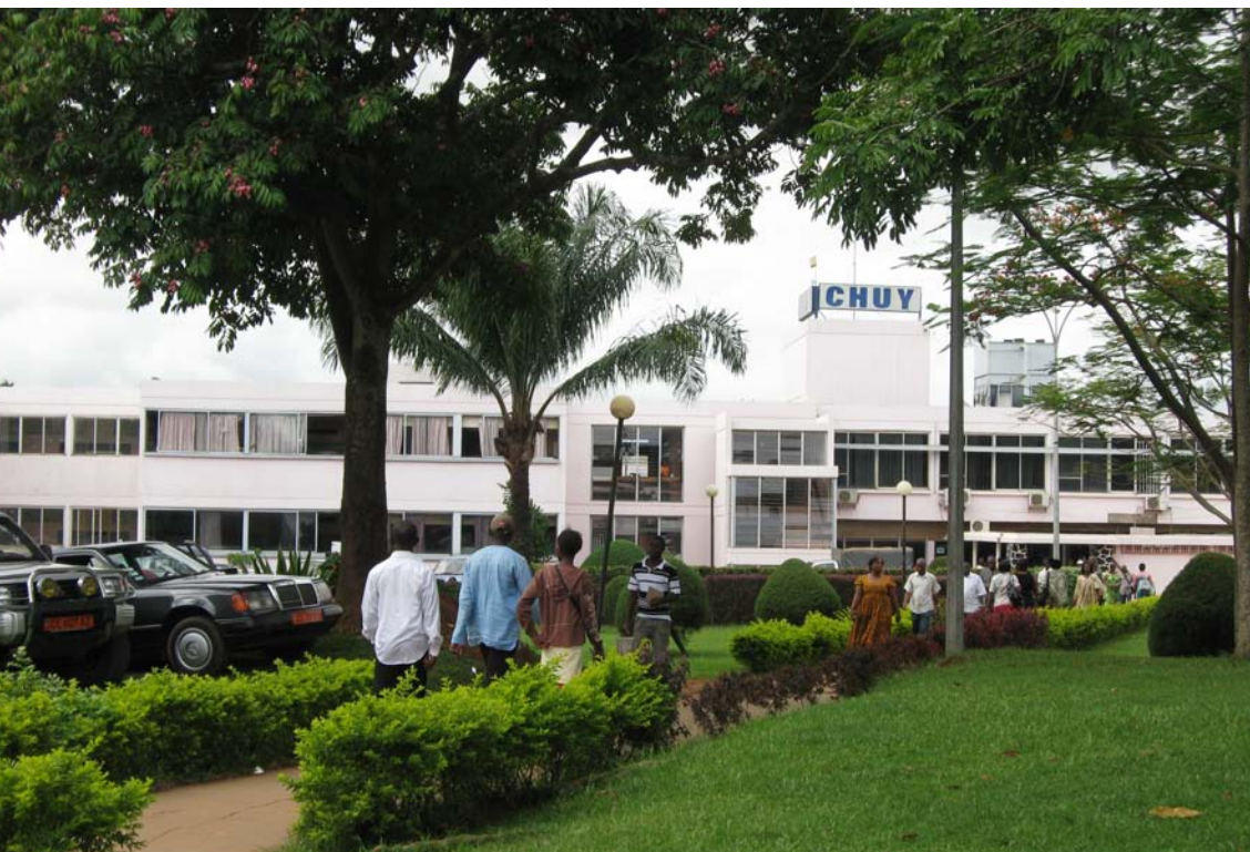
Le Centre Hospitalier Universitaire de Yaoundé

loir. Trois infirmières dont une en pleurs, un corps enveloppé de bleu sur un chariot brancard : quel- qu'un vient de mourir. « Ici, on vit la disparition d'une personne comme une fatalité. Il y a quelques jours, nous étions à la pause, on nous annonce la mort d'une jeune femme de 24 ans. Nous nous sommes étonnés : à 24 ans, que lui est-il arrivé? On nous a répondu : « on ne sait pas, c'est com-