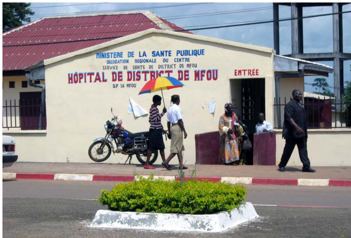
Hôpital de Mfou abritant un des cabinets de santé bucco-dentaire