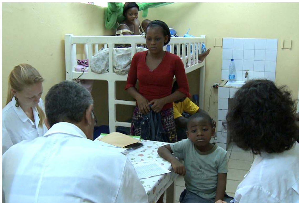
Stage en pédiatrie à la Fondation Chantal Biya