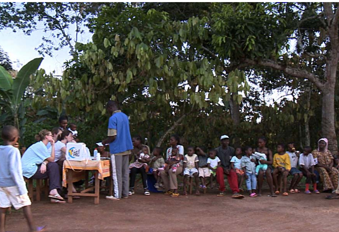
Les étudiants genevois participant à une campagne de vaccination

il est la seule école de médecine du pays et même d'Afrique centrale. Il se préoccupe d'éducation sanitaire et forme aussi bien des médecins généralistes que des personnels sanitaires (cadres en soins infirmiers et techniciens). L'enseignement y est orienté vers les besoins du pays et la santé publique, il encourage les contacts et le travail en équipe entre les étudiants en médecine et les autres professionnels de la santé.