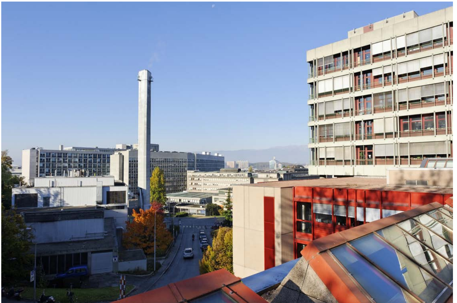
Le Centre Médical Universitaire (CMU) et les Hôpitaux Universitaires de Genève (HUG)