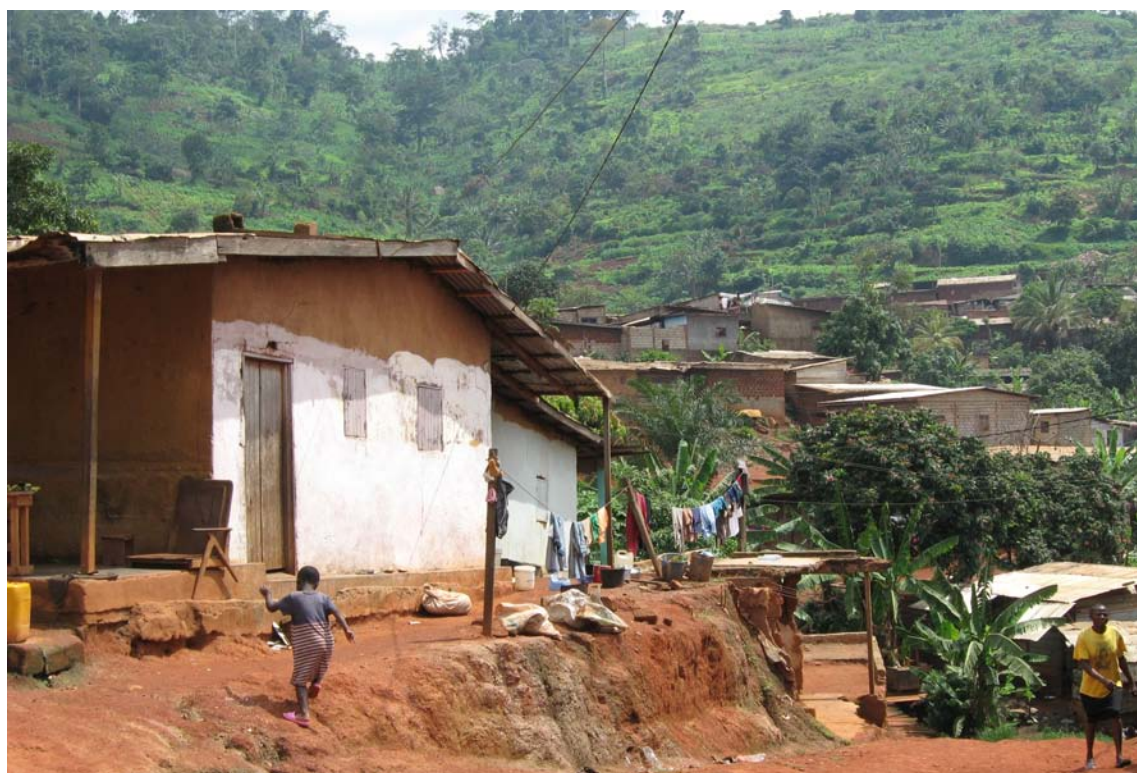
Conditions de vie difficiles à Yaoundé (quartier de Melen)

Même si Aude Charmillot ne s'est pas consacrée ultérieurement à la médecine tropicale, les expériences vécues au Cameroun lui sont utiles quotidiennement dans sa pratique actuelle de psychiatre. « À cause de leur maladie, mes patients ont des réactions différentes de celles de la plupart des gens. Mon expérience de Yaoundé m'aide