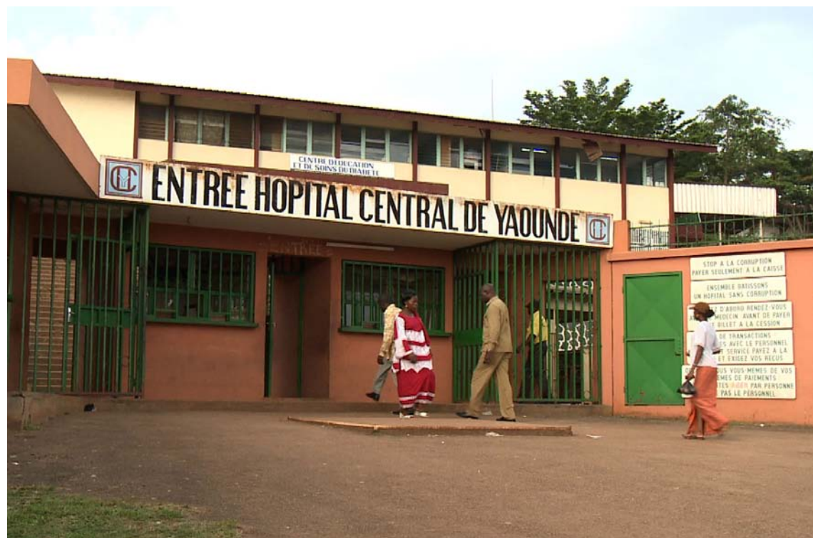
L'entrée de l'Hôpital Central de Yaoundé

Didier Pittet a terminé sa formation en médecine interne, s'est spécialisé en infectiologie et suivi une formation postgraduée aux États-Unis. De retour à Genève, il a établi le programme de prévention des infections nosocomiales aux HUG. L'OMS lui a confié