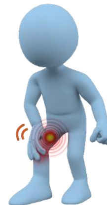
Боль в мышцах