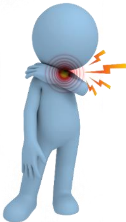
Боль в горле