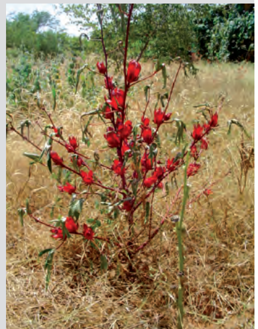
Pied de Hibiscus sabdariffa .