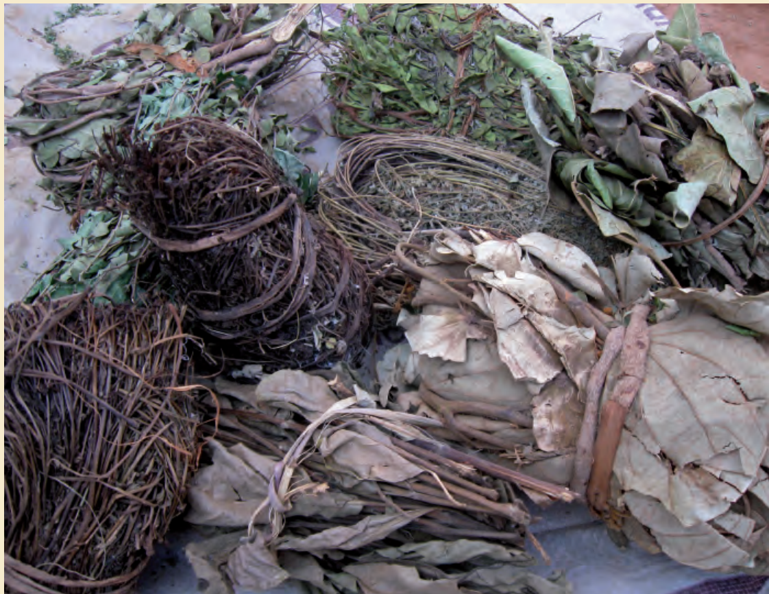
Bottes de tiges feuillées de cinq espèces médicinales.

3 Université de Gand Faculté des sciences en bio-ingénierie Laboratoire d'agronomie tropicale et subtropicale et d'ethnobotanique Coupure Links 653 9000 Gand Belgique