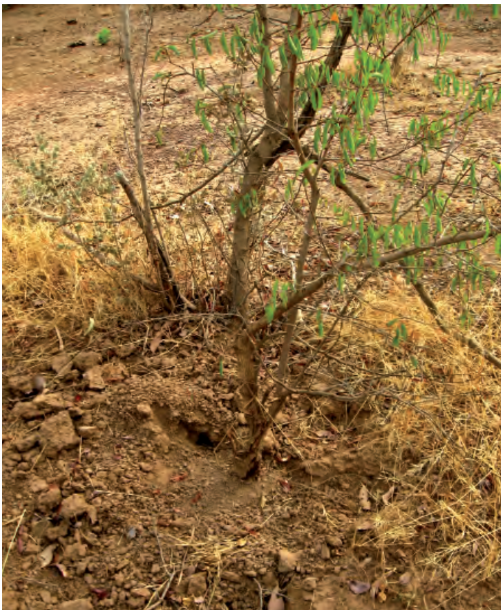
Pied de Ximenia americana déraciné.

La recherche du degré de consensus d'utilisation des plantes a révélé une absence de consensus de thérapie à proposer pour une maladie donnée. La complexité du domaine de la médecine traditionnelle justifierait cette absence de consensus. En effet, la maladie étant culturelle, une réponse plurielle est alors apportée à toute maladie (NACOULMA-OUÉDRAOGO, MILLOGO-RASOLODIMBY, 2002). Le domaine est d'autant plus complexe que les connaissances secrètes sont le plus souvent transmises oralement, soit de père en fils, soit auprès des détenteurs qui les confient difficilement. À celles-ci s'ajoutent les expériences personnelles du Tps acquises au cours de l'exercice de son métier, variables selon l'origine géographique, la culture locale et le sexe (PFEIFFER, BUTZ, 2005). De plus, les divers rituels associés aux recettes (incantations, quantité de plantes) rendent davantage complexe la médecine traditionnelle. Ces rituels sont liés au genre : le traitement d'un homme ne serait efficace qu'après trois séances tandis qu'il en faudra quatre pour la femme. Cependant, les valeurs observées autour des recettes utilisées pour les troubles digestifs (0,49) ou musculo-squelettiques (0,47) et les infections (0,47) seraient liées à l'efficacité des plantes utilisées. Les Tps Sanan connaîtraient mieux les vertus thérapeutiques de ces plantes. Ces résultats pourraient être aussi attribués à la prévalence de ces affections dans la zone, qui ont constitué