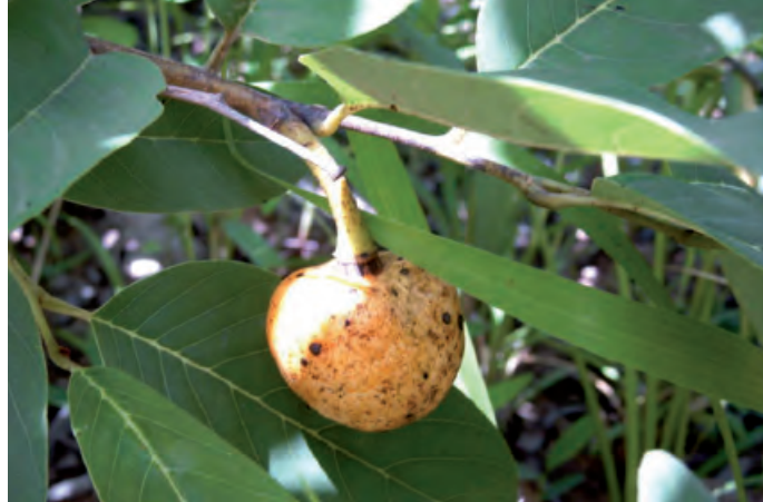
Fruit mûr de Annona senegalensis .

Les Sanan constituent la population la plus nombreuse (54 %) du pays San ; ils parlent le san d'où l'appellation de pays San ou San-piè (en san ) donnée à la zone. Cette ethnie cohabite avec d'autres groupes ethniques burkinabè (Marka, Mossi, Peul, Bwa et Bobo) et maliens (Bambara, Minianka). Selon un rapport de l'Institut national de la statistique et de la démographie