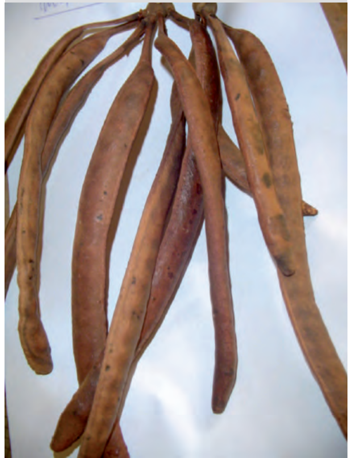
Gousses de Parkia biglobosa .