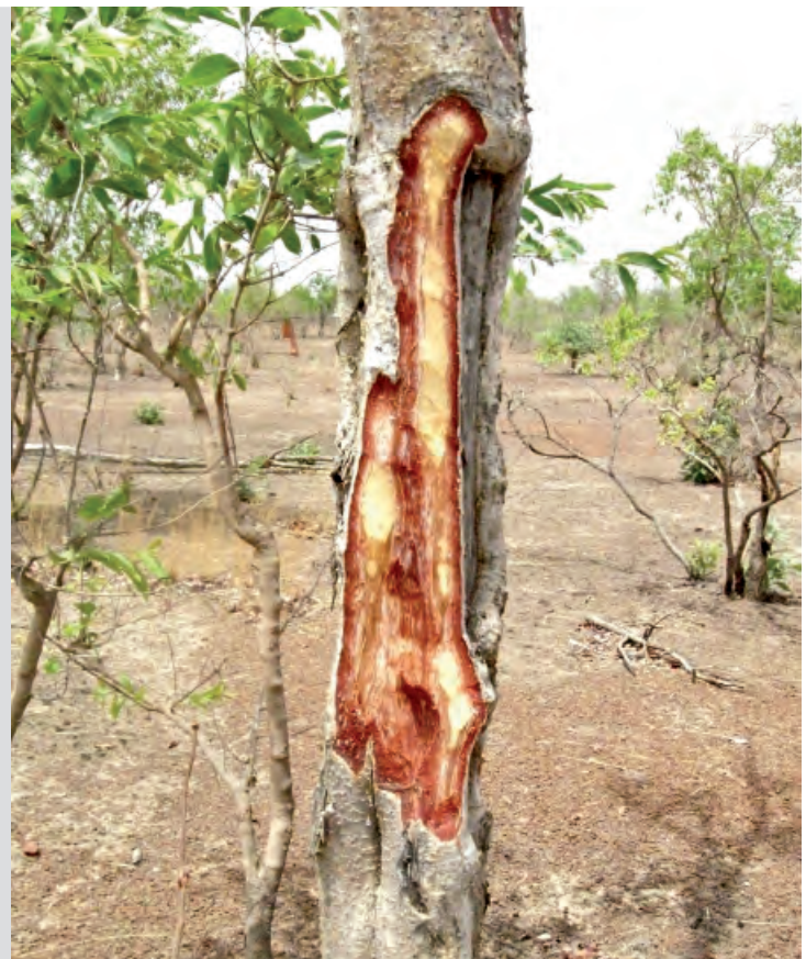
Tronc écorché de Boswellia dalzielii .