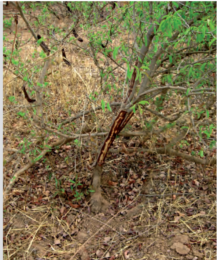
Tronc écorché de Ximenia americana .