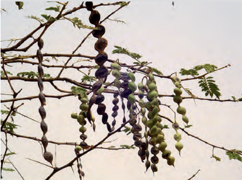
Gousses de Acacia nilotica .