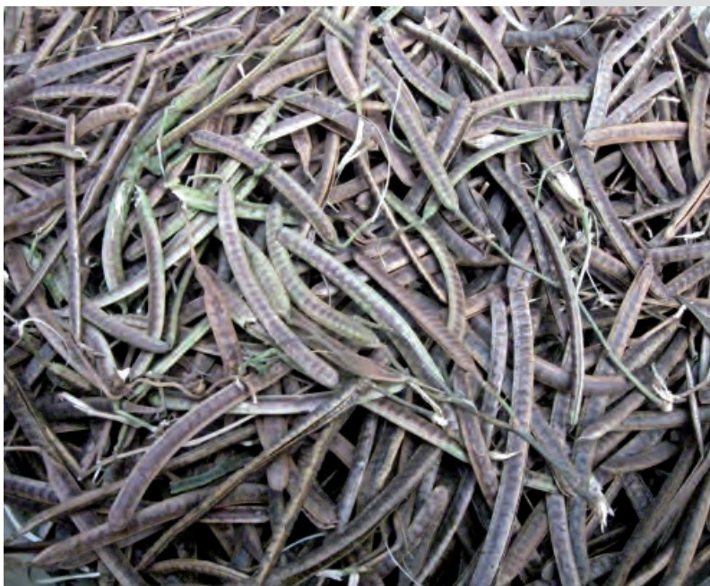
Gousses de Senna occidentalis .