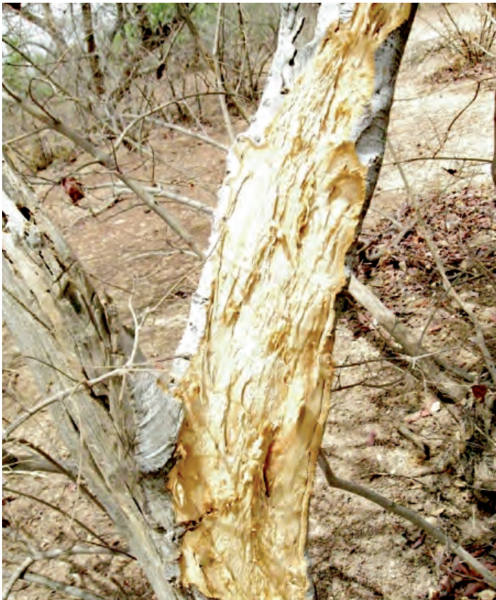
Tronc écorché de Dalbergia melanoxylon .

Les auteurs remercient le Fonds national pour l'éducation et la recherche (Foner) du Burkina Faso, les associations des tradithérapeutes du pays San (provinces du Sourou et du Nayala) et les personnes morales pour leur assistance technique et leur soutien financier.