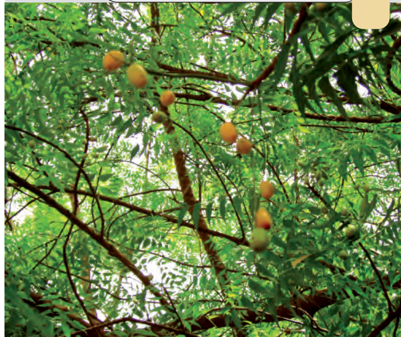
Fruits et tiges feuillées de Azadirachta indica .

Au plan scientifique, de nombreux travaux, notamment ethnobotaniques, biochimiques, et essais cliniques sur les plantes médicinales ont été réalisés dans le souci d'améliorer ce patrimoine culturel et d'y apporter une justification scientifique. Ainsi, certains travaux ethnobotaniques portent sur l'inventaire et l'utilisation de plantes médicinales de groupes ethniques spécifiques : les Mossi du plateau central (NACOULMA-OUÉDRAOGO, 1996) ou les Gourmantché à l'Est (THIOMBIANO et al. , 2002). D'autres travaux abordent diverses thématiques, notamment les plantes médicinales des jachères de l'Ouest (OLIVIER, SANOU, 2003) ou de la forêt classée de Niangoloko (OUÛBA et al. , 2006), les plantes utilisées dans le traitement des maladies bucco-dentaires (TAPSOBA, DESCHAMPS, 2006) ou les soins des enfants (BÉLEM, NANA-SANON, 2009). En plus des inventaires, d'autres travaux concernent la phytochimie, les potentialités biologiques et l'évaluation des activités biologiques de nombreuses plantes. Ainsi, des travaux d'analyse ont porté sur la phytochimie et les potentialités biologiques de cinq espèces d' Indigofera (Fabaceae) (BAKASSO, 2009) ou sur Bauhinia rufescens Lam. (Caesalpinaceae) et Stereospermum kunthianum (Cham.) (Bignoniaceae) (COMPAORÉ, 2010). D'autres études de vérification et d'expérimentation des recettes traditionnelles ont été également