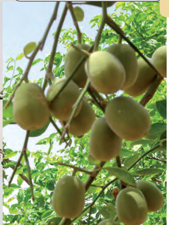
Fruits immatures de Balanites aegyptiaca .