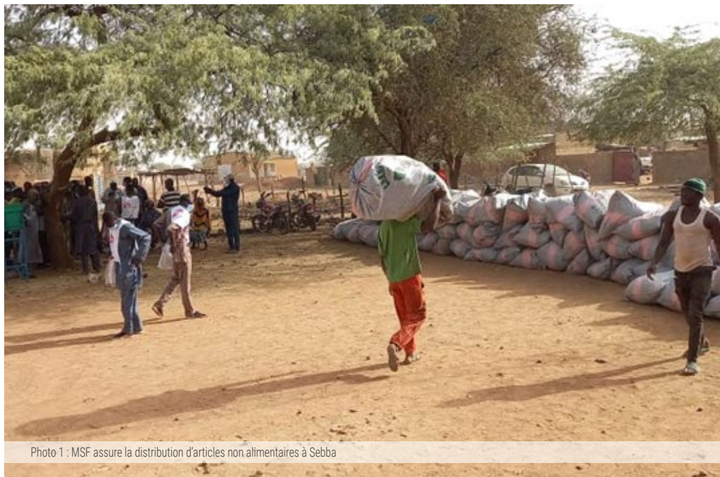
Photo 1 : MSF assure la distribution d'articles non alimentaires à Sebba