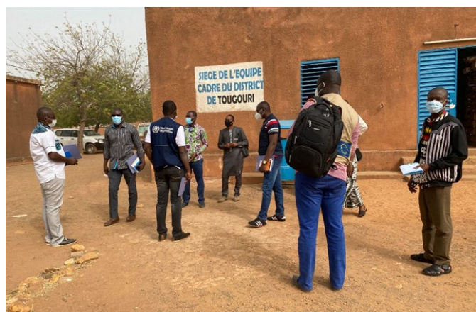
Photo 5 : Lors de la sortie conjointe appuyée par l'OMS le 19/02/2021 à Tougouri, région du Centre-Nord, de suivi de la réponse et d'évaluation des besoins sanitaires prioritaires