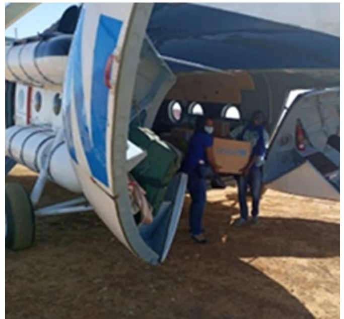
Photo 9 : Acheminement des 338 kits des médicaments par le vol UNHAS à Gorom-Gorom