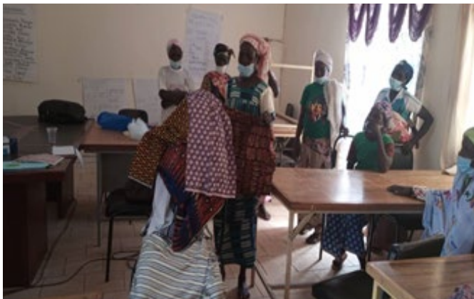
Photo 7 : Formation des AV de 6 CSPS du district sanitaire de Fada sur les VBG