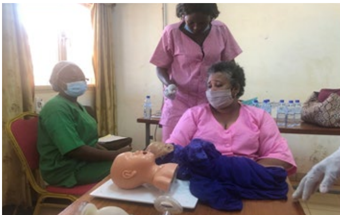
Photo 8 : La sage-femme de Kaya lors d'une activité de renforcement de capacité in situ