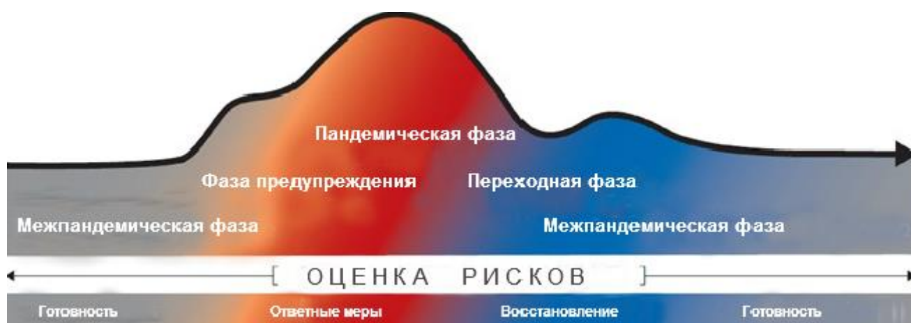
Рисунок 1: Последовательность пандемических фаз*

* Эта последовательность в динамике, в соответствии с «глобальным средним» случаем, основывается на постоянной оценке рисков и согласуется с более широкой последовательностью управления рисками чрезвычайных ситуаций.