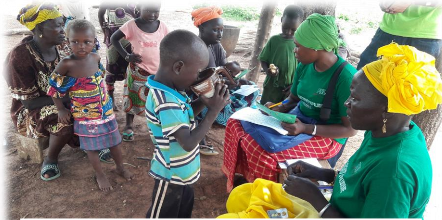
Administration à Togoro dans la commune de Kédougou.

Dans certains postes pour que le dispositif soit fonctionnel, les comités de santé ont pris en charge des relais supplémentaires pour renforcer les équipes. Ces relais sont renforcés pour le suivi de l'administration des doses de J2 et J3 par les « Badiéno gox » et les DSDOM durant les ratissages dans le cadre de la PECADOM PLUS.