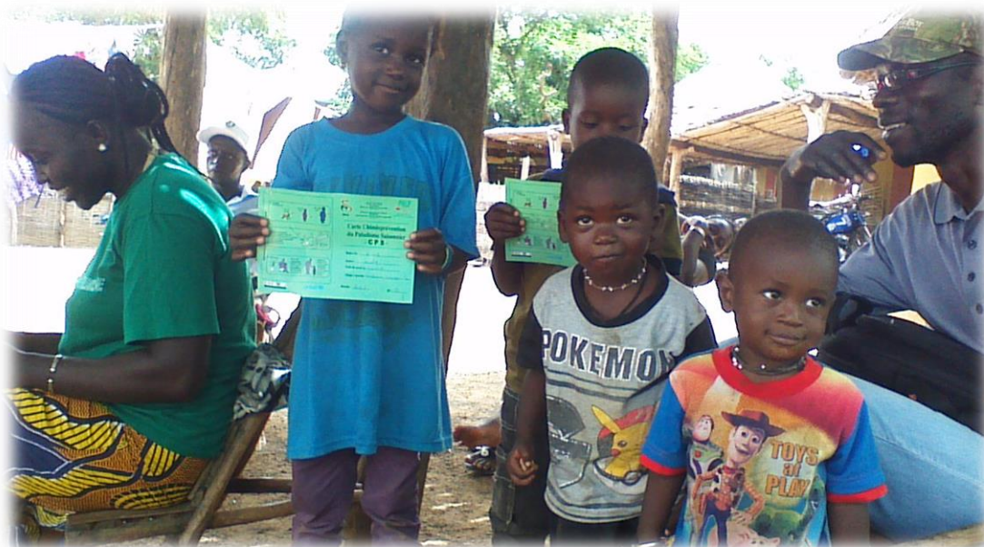
Administration à Mako dans le district de Kédougou sous la supervision de l'équipe intégrée RM/DS/PNLP/Partenaire (Représentant du service de l'action sociale à gauche sur la photo)

La région médicale de Kédougou a mobilisé les partenaires locaux (RESEAU SIGGIL JIGGEEN, ANCS, CMU, service de l'action sociale, FBR, NEEMA, PRN, BHR) sous le leadership du MCR avec une mobilisation importante de la logistique et des ressources humaines pour la supervision.