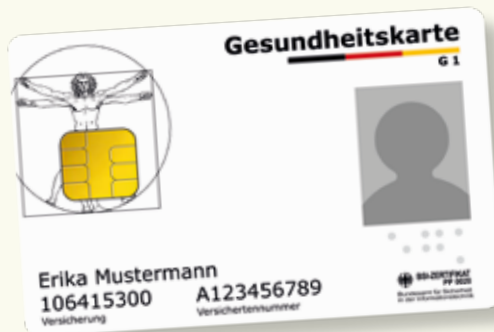
Musterbeispiel einer Gesundheitskarte

Bitte nehmen Sie immer Ihre elektronische Gesundheitskarte mit, wenn Sie Gesundheitsdienste in Anspruch nehmen. Seit dem 1. Januar 2015 gilt ausschließlich diese Karte als Berechtigungsnachweis, um Leistungen der gesetzlichen Krankenversicherung in Anspruch nehmen zu können. Auf der elektronischen Gesundheitskarte sind Ihr Name, Ihr Geburtsdatum und Ihre Anschrift sowie Ihre Krankenversicherungsnummer und Ihr Versichertenstatus (Mitglied, Familienversicherter oder Rentner) als Pflichtdaten gespeichert. Die elektronische Gesundheitskarte enthält außerdem ein Lichtbild von Ihnen.