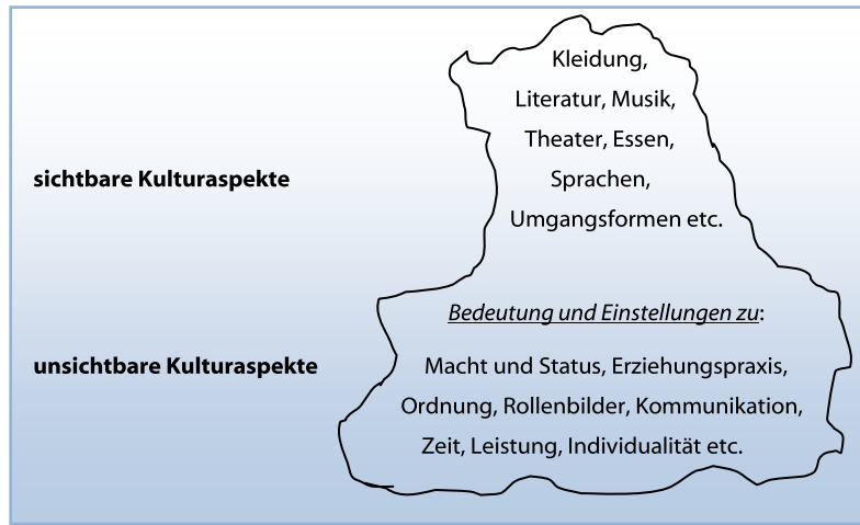
Abb. 1: Eisbergmodell

Einstellungen zu Erziehungspraxis, Individualität und Leistung von außen nicht sichtbar sind, was die Wahrscheinlichkeit für Missverständnisse erhöht (siehe Abb. 1).