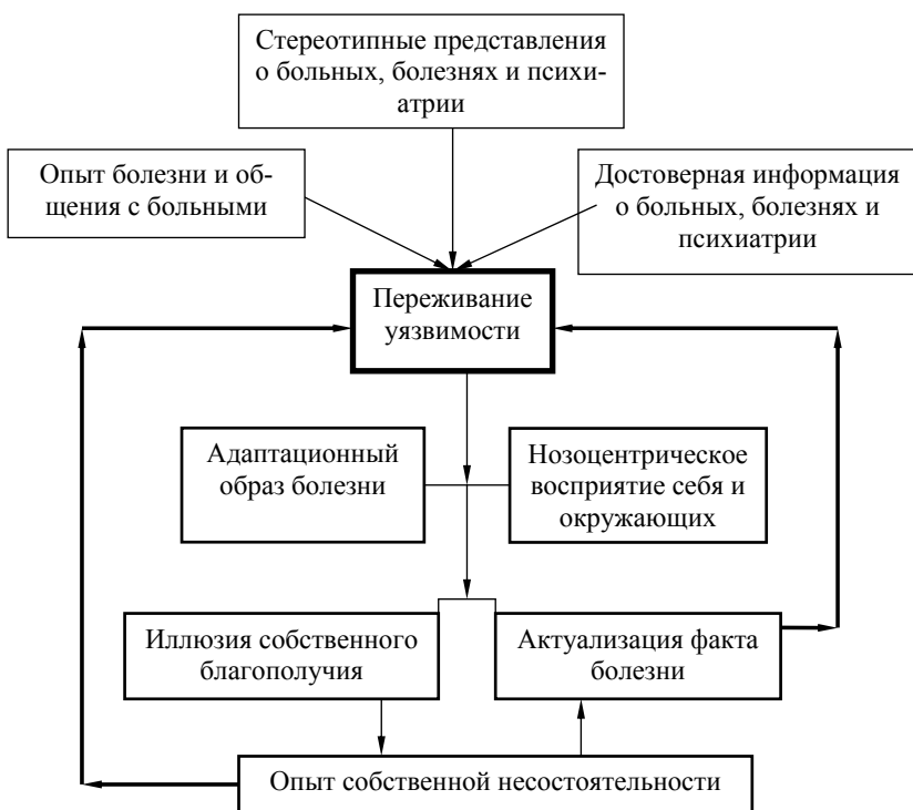
Рис. 2. Структурно-динамическая модель самостигматизации

В разных нозологических группах каждая форма самостигматизации отражает особый набор и тип взаимодействия клинических, личностных и иных факторов. Указанная закономерность определила необходимость разработки трех типологий самостигматизации.