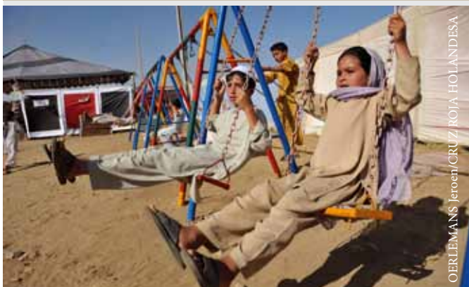
Apoyo psicosocial para comunidades afectadas por el conflicto en el valle del Swat, en Pakistán.

Cuando se aplica un enfoque psicosocial, se explora la manera de promover la resiliencia, buscando posibles maneras de fortalecer los recursos internos y externos de los individuos y las comunidades. Esto implica, por ejemplo, pasar revista a los mecanismos habitualmente aplicados por una comunidad para hacer frente a una crisis y analizarlos, con el propósito de encontrar la manera de fortalecerlos. Un enfoque basado en el concepto de resiliencia implica buscar maneras de fortalecer el poder y las capacidades que tiene la gente en lugar de centrarse en sus debilidades. El fin último es siempre asistir a las personas para que puedan cuidarse a sí mismas y a los otros.