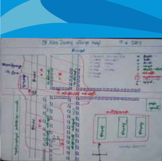
ရွာမြေပုံ - ထိခိုက်ခံရလွယ်မှုနှင့်စွမ်းဆောင်ရည်ဆန်းစစ်အကဲ ဖြတ်ခြင်း၏ ရလဒ်တစ်ခု

လူထုပါဝင်ဆောင်ရွက်ခြင်းသည် မည်သည့်ရပ်ရွာ/လူထု အခြေပြုလုပ်ငန်းတွင်မဆိုအဓိကဦးကျသော အချက်တစ်ချက်ပင်ဖြစ်သည်။အဘယ်ကြောင့်ဆိုသော်၎င်းသည်ဘေးအန္တရာယ်ကျရောက်မှုလုပ်ငန်းစဉ်များနှင့် ပတ်သက်၍ပြည်သူလူထု၏ပိုင်ဆိုင်မှုအပြင် အသိပညာကိုတိုးပွားစေပြီး နောင်တွင် မိမိတို့ကိုယ်တိုင်ဆောင်ရွက်လာတတ်စေရန် အခြေခံကျသောကြောင့်ဖြစ်သည်။ ရပ်ရွာအခြေပြုဘေးအန္တရာယ်လျော့ပါးရေး စီမံခန့်ခွဲမှုလုပ်ငန်း အစီအစဉ်တွင် ဘေးအန္တရာယ်ဖြစ်နိုင်ခြေရှိသော ရပ်ရွာ/လူထုသည် လုပ်ငန်းစဉ်တစ်လျှောက်လုံး ဘေးအန္တရာယ်ကျရောက်မှုစစ်ဆေးခြင်းမှ စတင်ပြီး ရလဒ်များတိုင်းတာနိုင်ရန် ခွဲခြားစိတ်ဖြာသည် အထိပါဝင်ရပါသည်။ဤနည်းဖြင့်ရပ်ရွာလူထုသည် ၎င်းတို့၏အသက် အန္တရာယ်ထိခိုက်စေနိုင်သည့် ပြဿနာများကို ဖြေရှင်းဆုံးဖြတ်ရာ၌အဓိကပုဂ္ဂိုလ်များအဖြစ်ပါဝင်ခွင့်ရကြပါသည်။ ရပ်ရွာလူထုအား စွမ်းဆောင်ရည်မြှင့်တင်ပေးခြင်းသည် အကောင်အထည်ဖော်ဆောင်ရွက်သူများ၏ ကြီးမားသော တာဝန်ရယူမှုပင်ဖြစ်သည်။ အကျိုး သက်ရောက်မှုမှာလူထု၏ အသိပညာတိုးပွားသည်နှင့်အမျှ ၎င်းတို့သည်ပိုမို ကောင်းမွန်သော လုပ် ငန်းဆောင်ရွက်မှုများ(လူသားချင်း ကူညီထောက်ပံ့မှုဆိုင်ရာ-humanitarian နှင့်ဘေးအန္တရာယ်လျော့ပါးမှု)ကိုသဘောပေါက်တောင်းဆို နိုင်မည်ဖြစ်သည်။