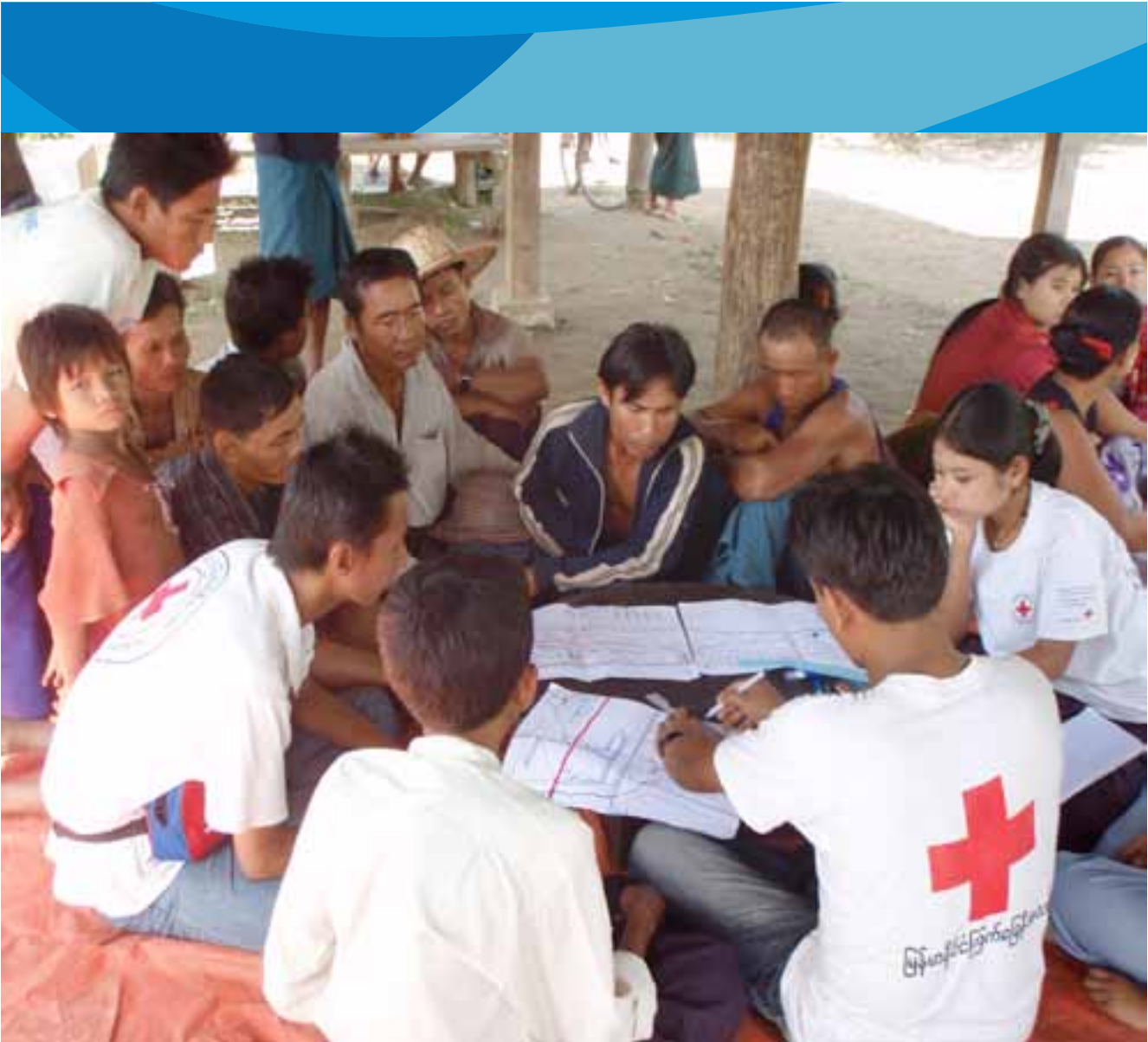
ရပ်ကွက်ပြည်သူများ မြန်မာနိုင်ငံပြန်လည်ထူထောင်ရေးအဖွဲ့ (VCA) ထိခိုက်လွယ်မှုနှင့် စွမ်းဆောင်ရည်အကဲဖြတ်စစ်ဆေးမှုများပြုလုပ်နေကြပုံ

ကျင့်မှုဆိုင်ရာမြှင့်တင်ရေးသင်တန်းများကိုခြုံငုံမိပါသည်။ VCA နှင့် နိုင်းယုဉ် ရာတွင်ဘက်ပေါင်းစုံအကဲဖြတ်စစ်ဆေးမှုသည် စီမံချက်လုပ်ငန်းအစီအစဉ်၏ ဘေးအန္တရာယ်ကြိုတင်ကာကွယ်မှုနှင့် ပတ်သက်သည့် အားနည်းချက်များကို လည်းသိရှိရန်မကကျန်းမာရေးနှင့် အသက်မွေးဝမ်း ကျောင်းလုပ်ငန်းများနှင့် ပတ်သက်သည့်အားနည်းချက်များကိုစစ်ဆေးရရှိစေနိုင်ပါသည်။