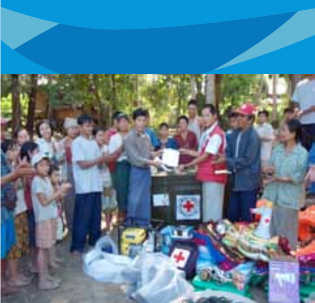
မြို့နယ်အရေးပေါ်သုံးပစ္စည်းများထည့်ထားသည့်သေတ္တာကို ရပ်ရွာလူထုအားပေးအပ်နေစဉ်

ဘေးအန္တရာယ်လျော့ပါးရေးအစီအစဉ်များကို အကောင်အထည်ဖော်ရာတွင် ကျေးရွာဘေးအန္တရာယ်လျော့ပါးရေးစီမံခန့်ခွဲမှုကော်မတီတိုင်းကို ဆပ်ကော်မ တီခွဲများခွဲပြီးအရေးပေါ်လုပ်ငန်းဖြစ်သည့် ထိခိုက်မှုလျော့နည်းရေး၊သတင်းအ ချက်အလက်နှင့်ပြန်ကြားရေး၊တုန့်ပြန်မှု၊ပြန်လည်ထူထောင်ရေး၊ စသည့်လုပ် ငန်းများကိုလုပ်ဆောင်ကြသည်။ကော်မတီခွဲတိုင်း၏ အခန်းကဏ္ဍနှင့် တာဝန် များကိုရှင်းလင်းပြတ်သားစွာအစီအစဉ်ရေးဆွဲထားသောကြောင့်ရှုပ်ထွေးမှု များနှင့်လုပ်ငန်းအစီအစဉ်ထပ်ခြင်းများကိုရှောင်ရှားနိုင်ပါသည်။အကောင်အထည် ဖော်လုပ်ငန်းများကိုပိုမို၍ကူညီထောက်ပံ့သည့်ရန် ဘေးအန္တရာယ်ကျရောက်မ ည့်လျော့ချရေးသေတ္တာများကိုဦးတည်ထားသောရပ်ရွာများတွင်ဖြန့်ဝေခဲ့ပါသည်။ ။ ငှင်းသေတ္တာထဲတွင် ကြိုတင်သတိပေးသည့်ကိရိယာနှင့် အတူ အိမ်သုံးပစ္စည်း များ ဖြစ်သည့်စောင်မီးဖိုချောင်သုံးပစ္စည်းများ၊)ပြန်ကြားရေးနှင့်ဆက်သွယ်ရေး ပစ္စည်းများဖြစ်သည့်ရေဒီယို၊ လက်ကိုင်စကားပြောခွက်၊ အစရှိသည့်ပစ္စည်း များပါဝင်ပါသည်။