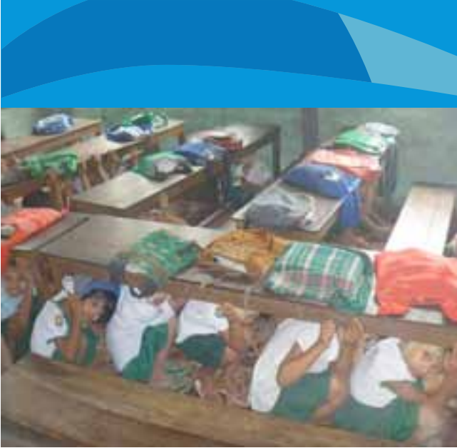
ကျောင်းတွင်ကျောင်းသား/သူများ သင်္ဘောနံတူလေ့ကျင့်နေကပုံ

စီမံချက်အကောင်ထည်ဖော်ခြင်းအဆင့်ဆင့်တွင် လူထုကင်းတို့၏ အချိန်နှင့်အရင်းအမြစ်များကိုမျှဝေရန်ဆန္ဒမရှိပါက စီမံချက်လုပ်ငန်း အစဉ်သည် အကျိုးရလဒ်နည်းပါးကာရည် ရှည်အောင်မြင်တည်တံ့ မှုရရှိမည်မဟုတ်ပေ။