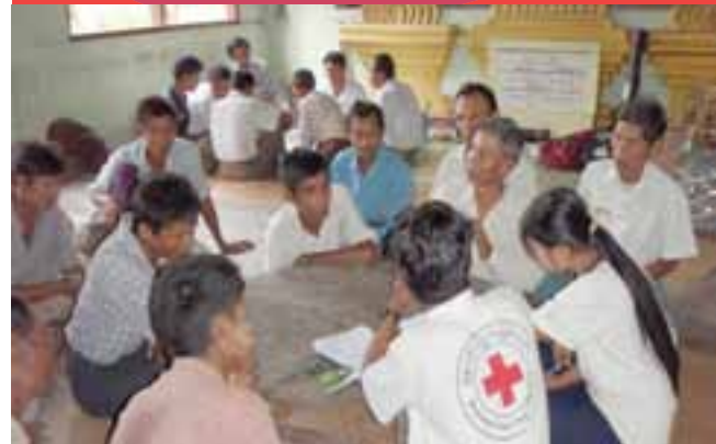
ကျေးရွာအခြေအနေများကိုစစ်ဆေးနိုင်ရန် မြန်မာနိုင်ငံကြက်ခြေနီအသင်းမှဝန်ထမ်းများနှင့်ကျေးရွာလူထုတို့ညှိနှိုင်းဆွေးနွေးတိုင်ပင်နေကြပုံ

ဘေးအန္တရာယ်လျော့ပါးရေးအစီအစဉ်တိုင်းတွင်ဘေးအန္တရာယ်ကျရောက်နိုင်ခြေအရှိဆုံးသော မြို့နယ်များကို ရွေးချယ်ရာ၌ပြည်နယ်နှင့် တိုင်းဒေသကြီးတွင် ဘေးအန္တရာယ်ကျရောက်ရောက်မှုများကိုဖော်ပြထားသောသတင်းအချက်အလက်မှတ်ထမ်းမှတ်ရာများကို ပြန်လည်ကြည့်ရှုစစ်ဆေးခြင်းမှ စတင်ပါသည်။ ဘေးအန္တရာယ်သတင်းအချက်အလက်စစ်ဆေးမှုမှရရှိသောသတင်းအချက်အလက်များနှင့်ဘေးအန္တရာယ်ကျရောက်ခံခဲ့ရသောဖြစ်စဉ်ရှိသည့်သတင်းအချက်အလက်များသည်စီမံချက်အစီအစဉ်များပြုလုပ်မည့်မြို့နယ်ရွေးချယ်ခြင်းလုပ်ငန်းများအတွက် အဓိကအချက်များပင်ဖြစ်သည်။ တစ်ခါတစ်ရံ ပြည်နယ် (သို့) တိုင်းဒေသကြီးများ စကားတင်ရွေးချယ်မှုသည် ကမ်းရိုးတမ်းဒေသများကဲ့သို့ဘေးအန္တရာယ်ကျရောက်ရောက်မှုလျော့ပါးရေးလုပ်ငန်းများနှင့် ပတ်သက်၍မိမိလုပ်ရမည့် တိကျသည့် အစီအစဉ် ရှိနေခြင်းသည် နေရာဒေသရွေးချယ် ရာတွင် ရှင်းလင်းလွယ်ကူစေပါသည်။