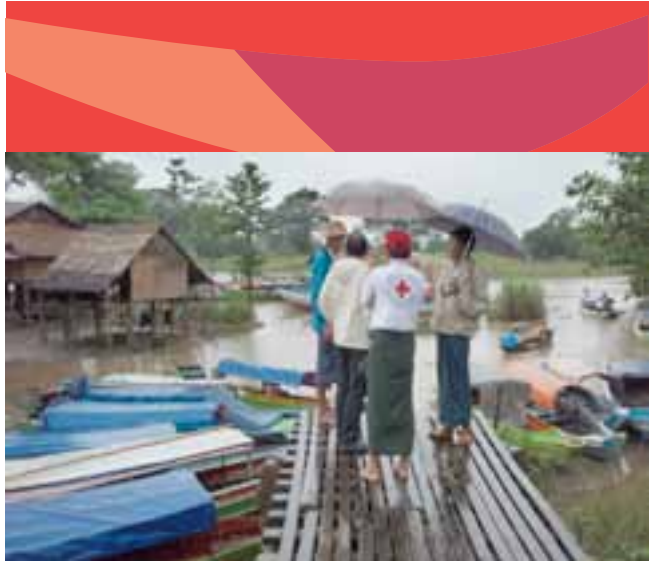
ကျေးရွာလူထုနှင့်တွေ့ဆုံရန်အန္တရာယ်ကျရောက်နိုင်မှုအမြင့်ဆုံးရှိသောအဆောက်အဦးများကို ပြသနေပုံ

အစီအစဉ်နှစ်ခုလုံး အနေဖြင့်ကျေး ရွာရွေးချယ်ခြင်း အစီအစဉ်များ ကို မြို့နယ်အဆင့် စီမံချက်အစီအစဉ်နှင့် ယိတွေ့ကျွမ်းဝင်မိတ်ဆက်ခြင်း အစည်းအဝေးကျင်းပပြီးစတင်ပါသည်။မြို့နယ်ကြက်ခြေနီအမှုဆောင်ကော်မတီ နှင့် အတူ မြို့နယ်ကြက်ခြေနီ စေတနာ့လုပ် အား ရှင် အဖွဲ့ .ဝင် များ နှင့်မြို့နယ်အာဏာပိုင်အဖွဲ့အစည်း များကဇယား(၂)တွင် ဖော်ပြထားသော စံသတ်မှတ်ချက်များကိုအခြေခံပြီးစီမံချက်ကျေးရွာအကြိုရွေးချယ်မှုစာရင်း ကိုပြုစုကြပါသည်။ထို့နောက်ယင်းအကြိုရွေးချယ်ထားသော ကျေးရွာများ၏ သတင်းအချက်အလက်များ၊ အထူးသဖြင့် ရပ်ရွာလူထုကပါဝင်ဆောင်ရွက်လိုမှုနှင့် ရပ်ရွာ၏ လူမှုစီး ပွားရေးအခြေအနေများကိုစိစစ်မှုများ ပြုလုပ်ပါသည်။ တိကျသောစစ်ဆေးလွှာပုံစံ (ကနဦးစစ်ဆေးလွှာပုံစံ) ကို ရပ်ရွာလူထုအခြေပြု ဘေးအန္တရာယ်လျော့ပါးရေး အစီအစဉ်တွင် အသုံးပြုပြီး ရပ်ရွာလူထုအခြေပြု ဘေးအန္တရာယ်စီမံခန့်ခွဲမှုအစီအစဉ်တွင် ရပ်ရွာ၏အခြေအနေများကို သိရှိရန်ကွင်းဆင်းလေ့လာမှုများ ပါဝင်ပါသည်။ လေ့လာတွေ့ရှိမှုများနှင့် အစကနဦးစစ်ဆေးမှုများမှရရှိသောမြို့နယ်သတင်းအချက်အလက်များအပေါ်တွင် အခြေခံ၍ကျေးရွာများ ရွေးချယ်ပါသည်။ အစီအစဉ်နှစ်ခုလုံးတွင်မြို့နယ် ကြက်ခြေနီအလုပ်အမှုဆောင်ကော်မတီအဖွဲ့ဝင်များကမြန်မာနိုင်ငံကြက်ခြေနီအသင်းဌာနချုပ်နှင့် ညှိနှိုင်းဆွေးနွေးပြီး အပြီးသတ်ရွေးချယ်ခြင်းကို တာဝန်ယူဆောင်ရွက်ရသည်။