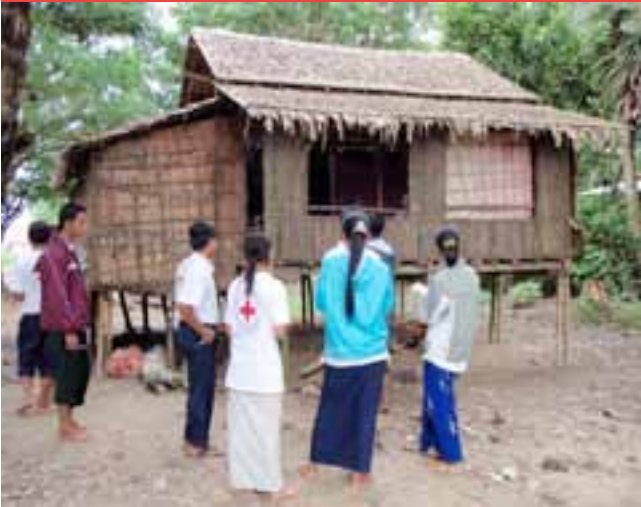
မြန်မာနိုင်ငံကြက်ခြေနီအသင်း ကြက်ခြေနီစေတနာ့လုပ်အားရှင်များ ကနဦးလေ့လာဆန်းစစ်မှုများပြုလုပ်နေပုံ

ရပ်ရွာလူထုအခြေပြု ဘေးအန္တရာယ်စီမံခန့်ခွဲမှု အစီအစဉ်များတွင် မြန်မာနိုင်ငံကြက်ခြေနီအသင်းသည် လူထုပါဝင်မှုနည်းဖြင့် အန္တရာယ်ကျရောက်မှုအများဆုံးနှင့် လူပတ်ဝန်းကျင်နှင့်ဖယ်ကျဉ်ခံထားရသောသူများ ထံမှထင်မြင်ယူဆချက်ဖွင့်ဟသံများကိုအများကြားသိစေသည်။