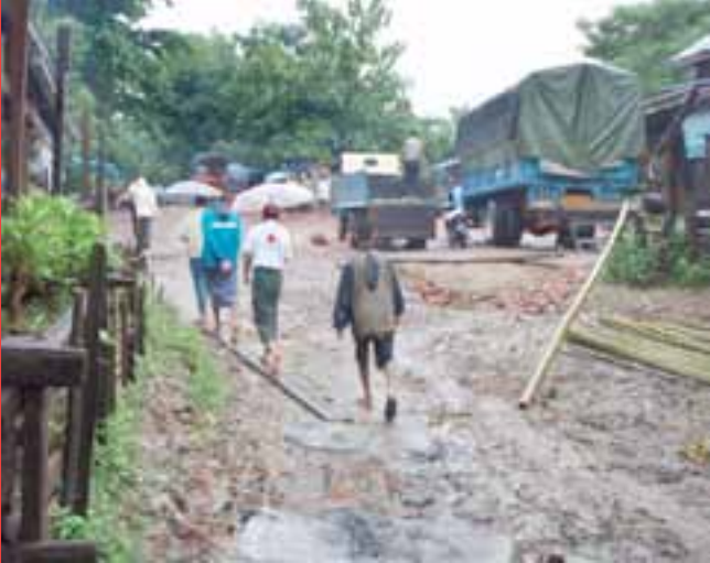
ရပ်ရွာလူထုနှင့်မြန်မာနိုင်ငံကြက်ခြေနီကွင်းဆင်းဝန်ထမ်း များဘေးအန္တရာယ်ကျရောက်မှုရှိသောရွာကိုလိုက်လံစစ်ဆေးနေကြပုံ