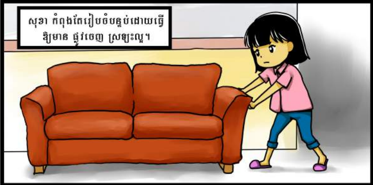
សុខា កំពុងកែរៀបចំបន្ទប់ដោយធ្វើ ឱ្យមាន ផ្លូវចេញ ស្រឡះល្អ។