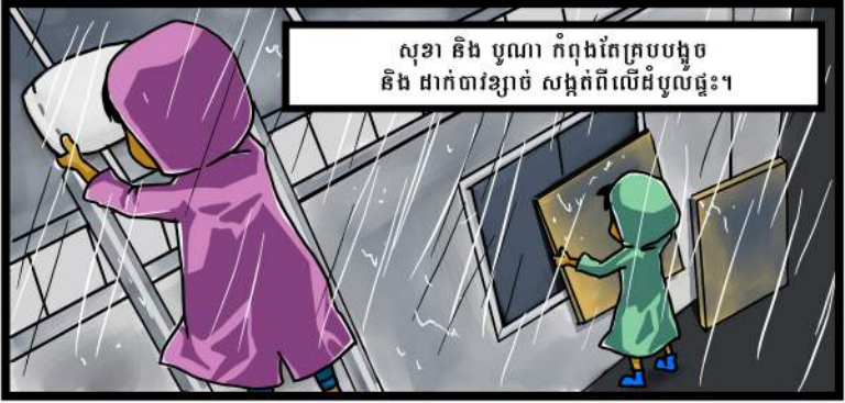
សុខា និង បូណា កំពុងកែត្របបង្អួច និង ដាក់បារ៉ាខ្សាច់ សង្កត់ពីលើដំបូលផ្ទះ។