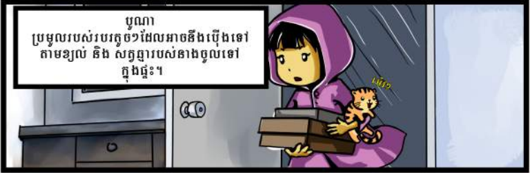
បូណា ប្រមូលរបស់របរតូចៗដែលអាចនឹងប្រើទៅ តាមខ្យល់ និង សត្វតូចៗរបស់នាងចូលទៅ ក្នុងផ្ទះ។