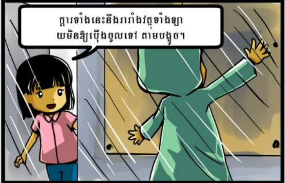
ក្តារទាំងនេះនឹងរារាំងវត្តទាំងឡាយ យើងមិនឱ្យប្រើឡើយទេ តាមបង្អួច។