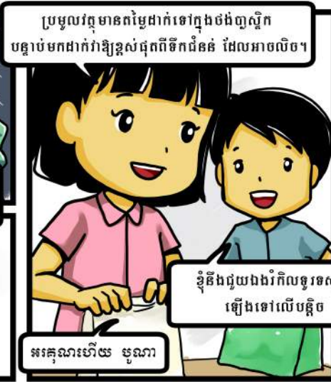
ប្រមូលវត្ថុមានតម្លៃដាក់ទៅក្នុងថង់ប្លាស្ទិក បន្ទាប់មកដាក់វាឱ្យខ្ពស់ជុំពីទឹកជំនន់ ដែលអាចលិច។