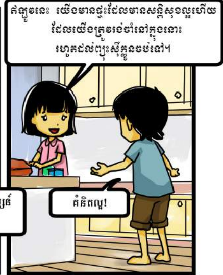
គិតចូលនេះ យើងមានផ្ទះដែលមានសន្តិសុខល្អហើយ ដែលយើងត្រូវចងចាំនូវក្នុងនោះ រហូតដល់ព្យុះស៊ីក្លូនចម្រើន។