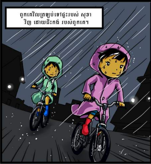
ពួកគេវិលត្រឡប់ទៅផ្ទះរបស់ សុខា វិញ ដោយជិះកង់ របស់ពួកគេ។