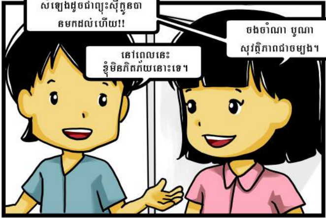
សំឡេងដូចជាព្យុះស៊ីក្លូនជា នមកដល់ហើយ!!