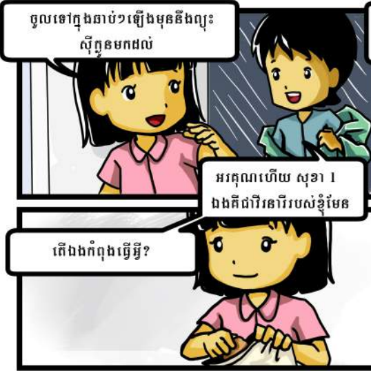
ចូលទៅក្នុងបន្ទប់ឱ្យឆាប់មុននឹងព្យុះ ស៊ីក្លូនមកដល់