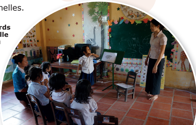
Enfants sourds dans une salle de classe au Cambodge

CBM collabore avec des partenaires aux niveaux local, national, régional et mondial en apportant un soutien technique et financier et en s'engageant dans l'établissement d'alliances et dans le plaidoyer. Ses partenaires au niveau mondial sont entre autres l'IDA (International Disability Alliance), l'IDDC (International Disability and Development Consortium), l'OMS (Organisation Mondiale de la Santé), l'ONU (Organisation des Nations Unies), et des organisations et associations professionnelles.