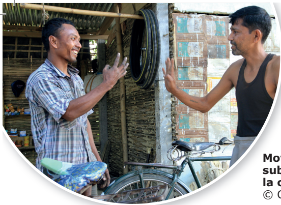
Moyens de subsistance dans la communauté