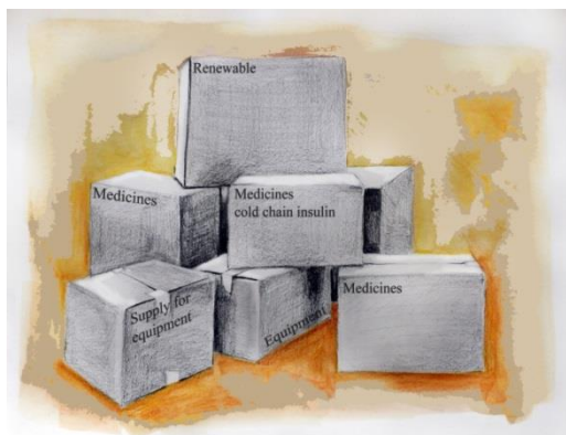
Table 1: Basic NCD kit modules with estimated weight and volume

The basic NCD kit consists of five submodules that can be ordered independently, depending on the needs, logistics and resources of the field (see Table 1 for the weight and volume of each of the five submodules). Modules (1a) to (1c) are renewables and therefore are design to last three months and cover a population of 10 000 people. Module (1e) is equipment and could last longer. Module (1d) contains renewables for the equipment in Module (1e). Module (1b) procurement requires the availability of an adequate cold chain.