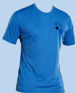
Funktionsshirt blau € 25,-