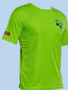
Funktionsshirt grün € 25,-

„I run for life“ und der dazugehörige DeutschlandCup sind langfristige Projekte der PalliativStiftung.