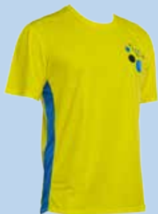
Funktionsshirt gelb € 25,-