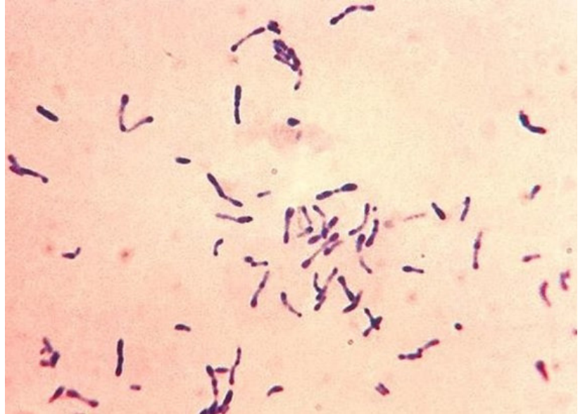
Corynebacterium , o mejor conocidos como difteriodes , vistos en el microscopio.