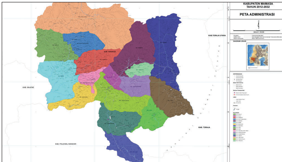
Gambar Peta Kabupaten Mamasa