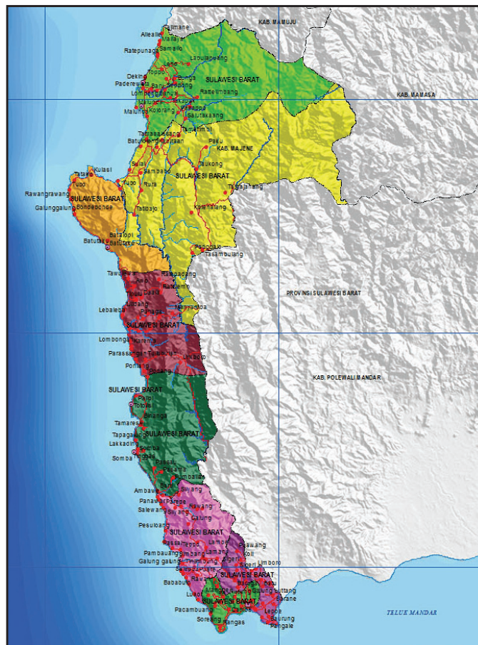
Gambar 2. Peta Kabupaten Majene