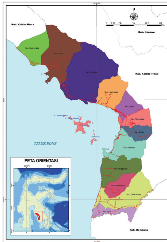
Gambar Peta Kabupaten Kolaka