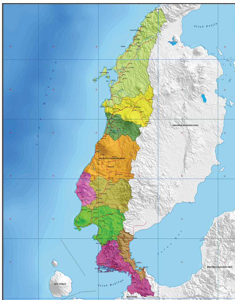
Gambar Peta Kabupaten Halmahera Barat