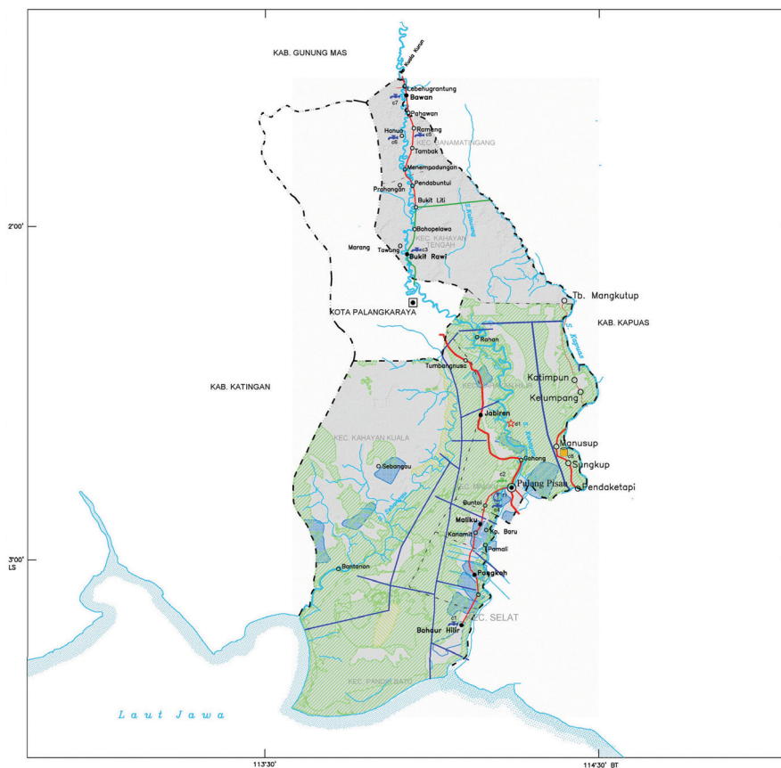
Gambar Peta Kabupaten Pulang Pisau