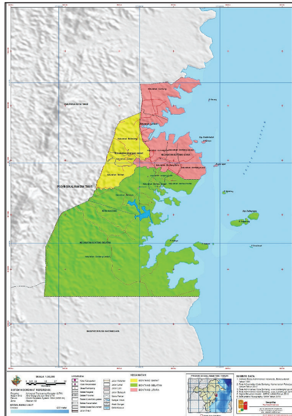
Gambar Peta Kota Bontang