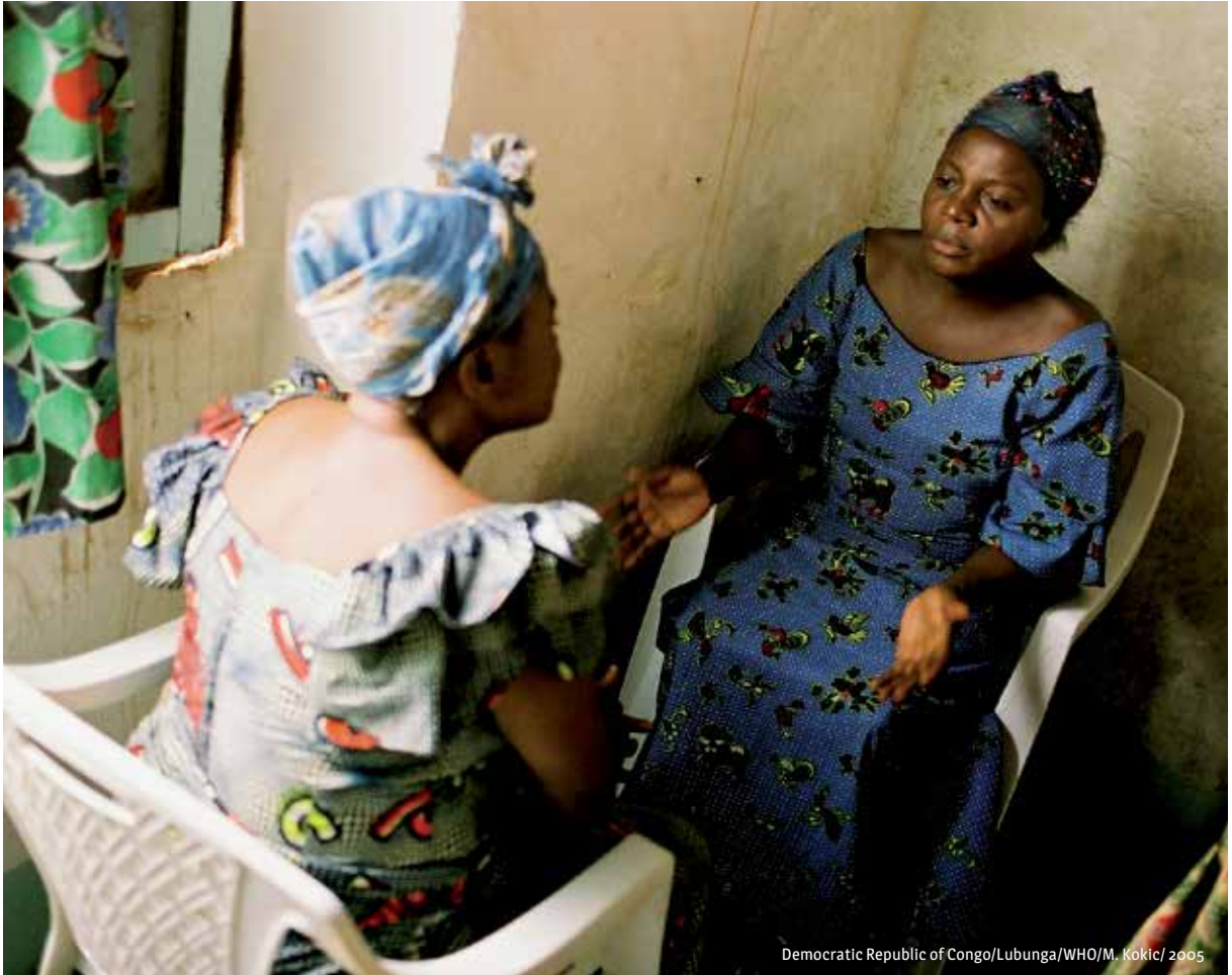
Democratic Republic of Congo/Lubunga/WHO/M. Kocik/ 2005