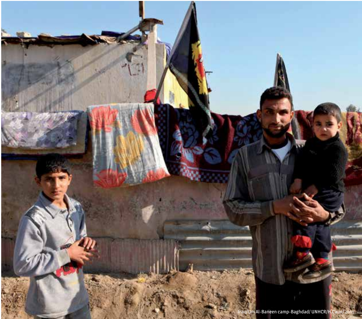
Iraq/Um Al-Baneen camp-Baghdad/ UNHCR/H. Caux/ 2011

(ت) لا يكون الأشخاص الذين ينظّمون تقديرات الصحة النفسية، في العادة، مخوّلين إطلاق هذا النظام. ولكن، حيثما يكون هذا النظام مطبّقاً فإنه ينبغي أن يحرص هؤلاء على تسجيل خدمات الصحة النفسية فيه، واستخدامه كمصدر أساسي من مصادر المعلومات ذات الصلة عن خدمات الصحة النفسية.