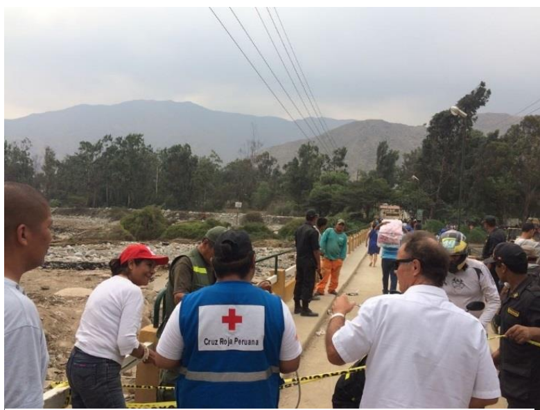
Evaluaciones de terreno en Chosica, Lima.

A nivel nacional en los 24 departamentos ha habido un grado de afectación particular en cada una de las zonas, actualmente se tienen registrado 72,115 personas damnificadas, 567,551 personas afectadas, 62 muertos y 170 heridos 1 . Las lluvias continúan en varias zonas del país las cuales ha afectado varias comunidades, centros educativos, 132 km carreteras y 227 puentes de acceso a las principales zonas, así como más de 22 mil hectáreas de agricultura; el Servicio Nacional de Meteorología e Hidrografía del Perú ha pronostica que las lluvias en la costa norte del Perú continuarán en los siguientes días.