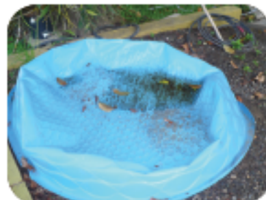
Vide dlo nan pisin lè ou p ap itilize yo.