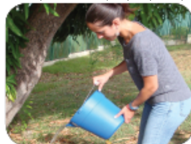
Vide epi jete nenpòt dlo ki chita.