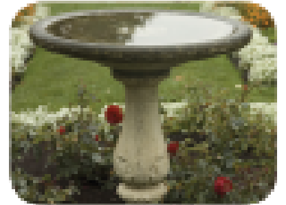
Chak semèn, retire dlo ki chita nan fontenn ak kote pou tizwazo benyen.