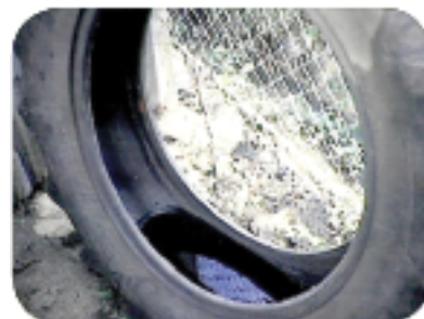
Resikle ansyen kawoutchou oswa pa kite yo kote yo ka mouye.