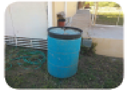
Kenbe barik dlo lapli yo kouvri byen sere.