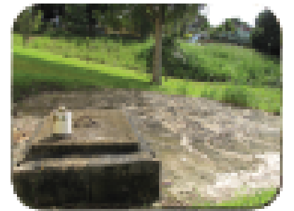
Kenbe fòs septik byen kondane.