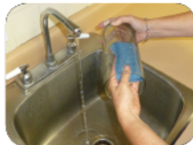
Chak semèn, foubi vaz & bèso ki gen ze marengwen.