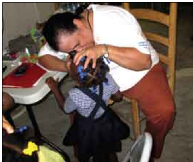
Consultation ophtalmologique en milieu scolaire dans le cadre d'une campagne de dépistage aux Abricots (Grande-Anse) avec Dr Brigitte Hudicourt du CNPC