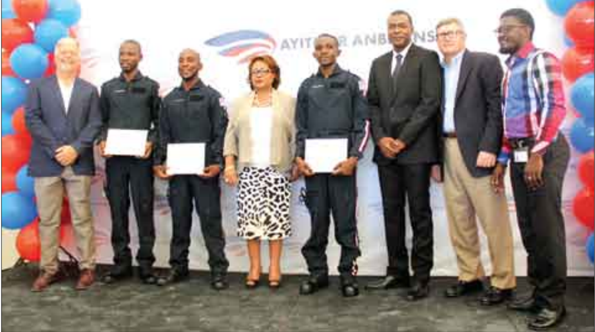
Formation de trois techniciens en prise en charge des urgences par voie aérienne (Ayiti Air Anbulans et MSPP) (septembre 2015)

La haute direction du Ministère de la Santé, en collaboration avec la Direction générale de la Police Nationale et le Ministère de la Justice, étudie une stratégie devant régir les ambulances qui prolifèrent de façon anarchique sans aucun respect des normes et standards requis en la matière.