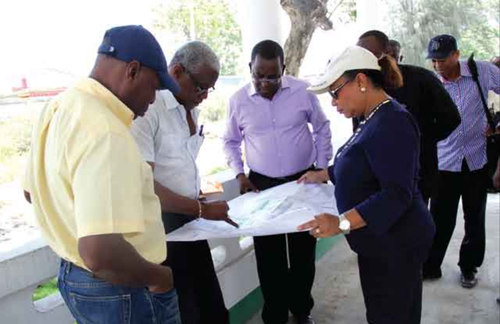
Visite du chantier des travaux d'extension de l'Hôpital Notre Dame du Perpétuel Secours de Bon Repos par la Ministre Dr Florence D. Guillaume ; M. Wilson Laleau, Ministre de l'Économie et des Finances ; le Ministre de la Planification et de la Coopération Externe, M. Yves Germain Joseph et les représentants de la firme responsable du chantier (juillet 2015)

Le rapport des statistiques des services 2014-2015 montre que 90% des rapports mensuels attendus ont été reçus (comparé à 87% en 2013 et 65% en 2012). Au moins un tiers de la population du pays (10,745,665), soit environ 31%, ont sollicité les services de santé disponibles aux niveaux communautaire et institutionnel.