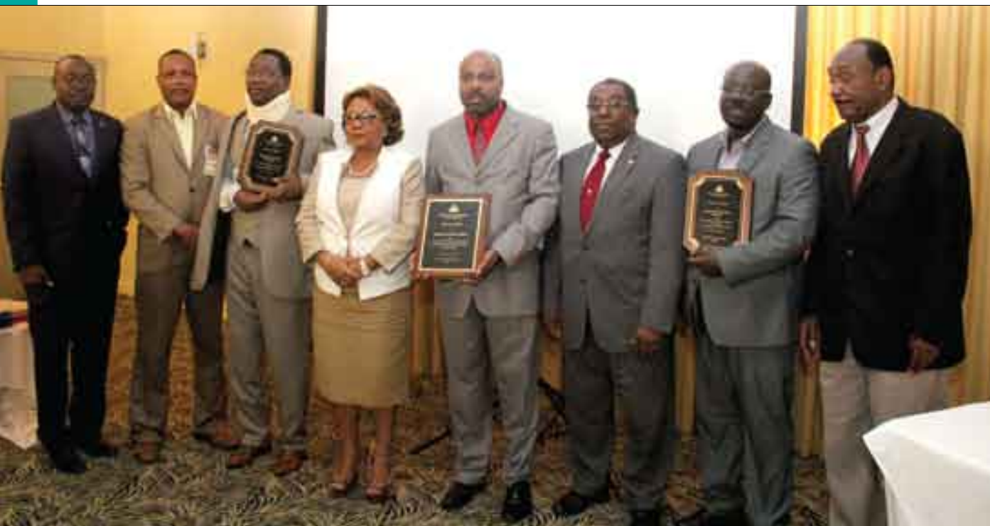
Remise des plaques de reconnaissance aux trois départements les plus performants au cours de l'année 2014 : le département des Nippes, le département du Nord et le département du Nord-Est (mai 2015)

Le renforcement de la gestion des services de santé passe par celui des Directions départementales qui doivent garantir la production pérenne des services et soins de qualité, accessibles à toutes les populations, et par celui des Directions Centrales qui doivent s'assurer de la disponibilité et de l'application des normes.