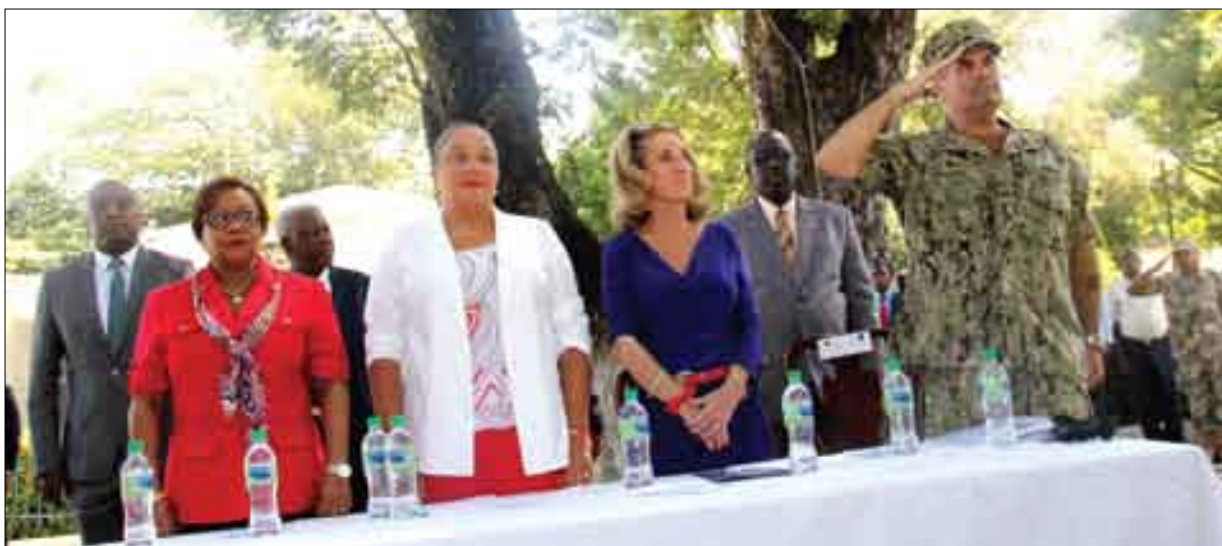
Bateau USNS Comfort - marine Haitienne sept 2015 (Premiere Dame de la République, Ambassadeur des Etats Unis, Ministre de la Santé Publique)

Par rapport à ces objectifs fixés depuis 2012, ces « Grandes Réalisations 2014-2015 » viennent s'ajouter à celles déjà présentées au cours des trois années antérieures (2011-2012, 2012-2013, 2013-2014).