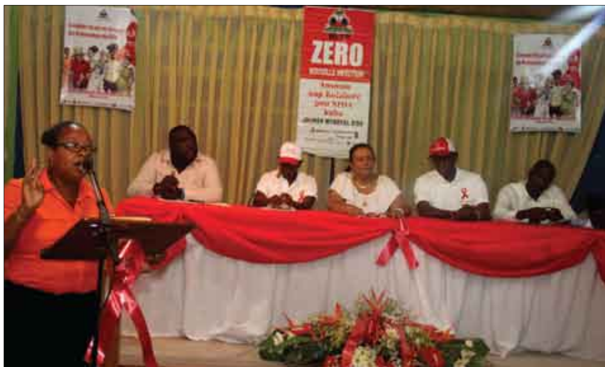
Journée Mondiale Sida (décembre 2014)

La Riposte nationale face au VIH s'est intensifiée au cours de ces dernières années, particulièrement en 2014-2015 pour maintenir stable le niveau de prévalence nationale de 2.2% tout en espérant une inversion de la tendance à l'horizon de 2017-2018. Un défi de taille, avec la récente étude de PSI sur les groupes clés dont les résultats ont été publiés en 2015, est la prévalence chez les «Hommes Ayant des Rapports Sexuels avec d'Autres Hommes» de 12.9% et chez les «Professionnelles du Sexe» de 8.7%. A la fin de 2014, le nombre de PVVIH était estimé à 150,000 [130,000 ; 170,000]. Le nombre de personnes contaminées par le VIH en 2014 est estimé à 8,200 et le nombre de décès à 5,000. Toutes ces estimations ont été effectuées avec l'aide de l'outil SPECTRUM ONUSIDA.