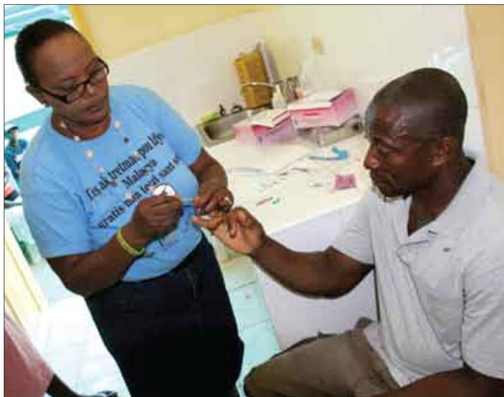
Administration du Test Rapide pour la Malaria (TDR) lors de la Campagne de lutte contre la Malaria dans la Grande Anse (avril 2015)

L'objectif du premier des neuf axes stratégiques du Plan Stratégique National de Contrôle de la Malaria 2009-2013 avec extension en 2015 était de «Renforcer et intensifier la prise en charge des cas de paludisme en diagnostiquant et traitant systématiquement tous les cas conformé-