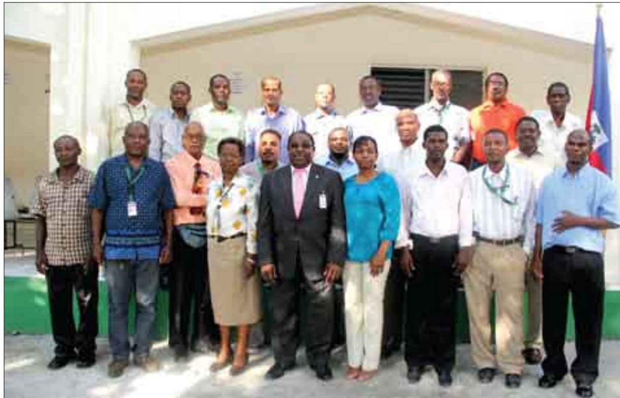
Formation d'un groupe de chauffeurs du niveau central du MSPP (décembre 2014)