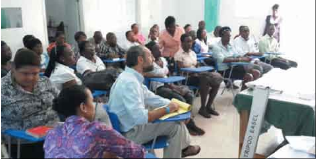
Formation des prestataires de santé du Nord sur la détection des troubles de développement de l'enfant

principaux hôpitaux (départementaux et HCR) situés sur tout le territoire. Le Ministère est au tout début de l'initiative en commençant par les HCR construits dans le cadre de la Tripartite à savoir l'Hôpital Raoul Pierre-Louis d'Arcachon 32 et de Bon Repos.