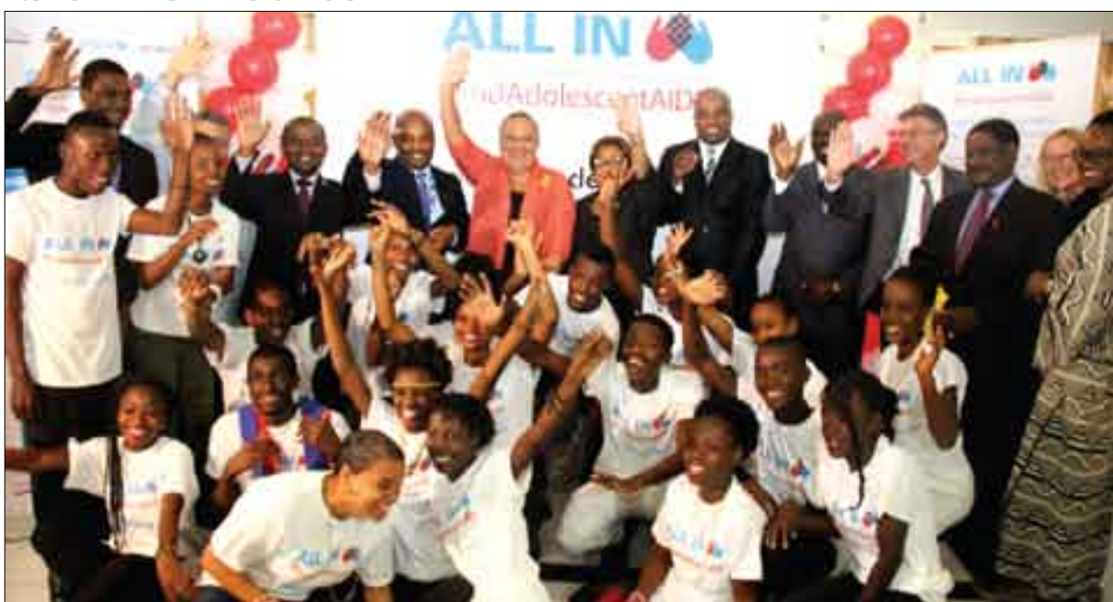
Lancement de l'initiative «All in» (nou tout konsène) sous le haut patronage de la Première Dame de la République, Mme Sophia Martelly conjointement avec le gouvernement haïtien et les autres acteurs de la lutte contre le Sida (septembre 2015)

Cet aspect est principalement fait par des partenaires non gouvernementaux sensibilisant les jeunes à l'adoption de comportements sécuritaires (sexualité responsable, prévention du VIH, lutte contre le tabac, l'alcool et la drogue etc...). Le Ministère élabore les matériels de sensibilisation et d'éducation destiné à ce groupe cible réputé sensible.