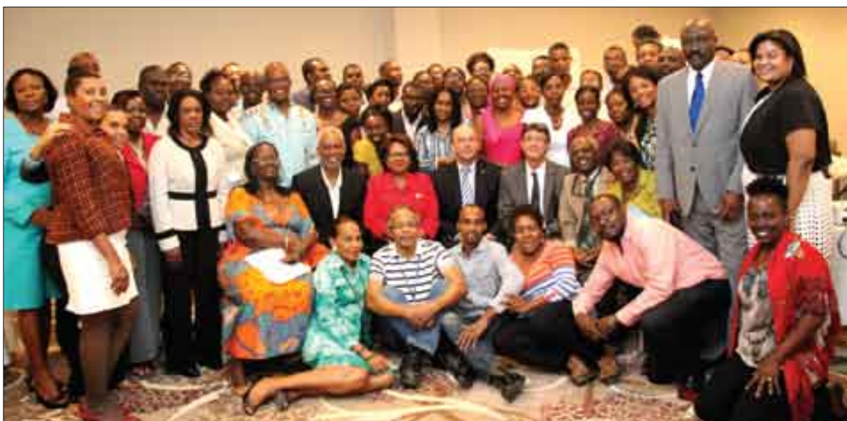
Participants à l'atelier de consultation nationale sur la PTME (Programme de Transmission Mère-Enfant) (mars 2015)

Durant l'exercice 2014-2015, la Direction de la Santé de la Famille du MSPP chargée de la définition et de la mise en application des politiques relatives à la santé de la reproduction a poursuivi l'exécution du Plan Stratégique Santé de la Reproduction 2013–2016 dans ses différents volets :