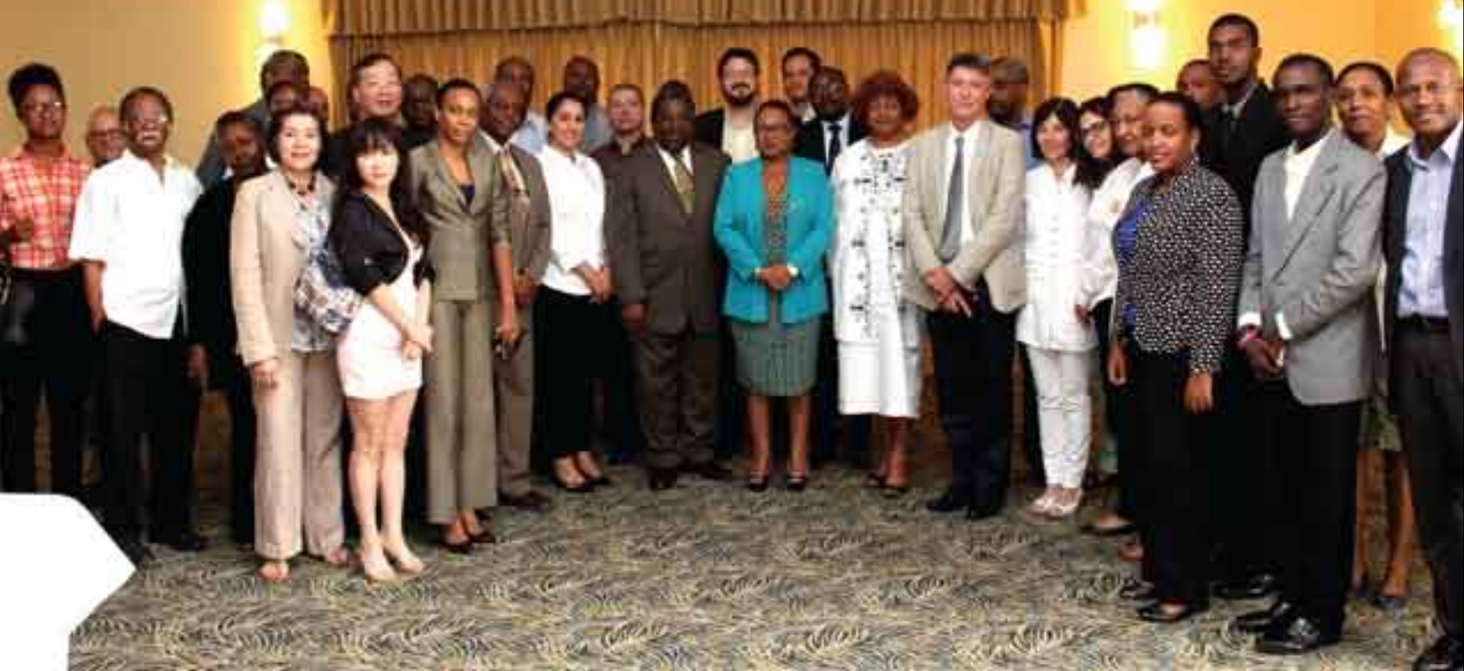
Partenaires du MSPP à la Table sectorielle du secteur santé (août 2015)