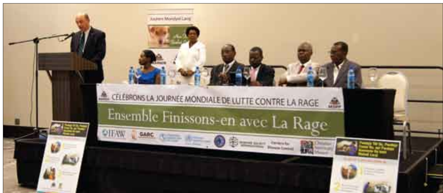
Journée Mondiale de Lutte contre la Rage (septembre 2015)

En coordination avec le Ministère de l'Agriculture, des Ressources Naturelles et du Développement Rural (MARNDR) et la Direction d'Épidémiologie, de Laboratoire et de Recherches au MSPP (DELR) qui assure la surveillance, la Direction de Promotion de la Santé et de Protection de l'Environnement (DPSPE) a entamé un processus de restructuration du programme de lutte contre la rage avec l'appui de l'OPS/OMS et de CDC. Le MSPP a maintenant un cadre responsable des activités de conscientisation des responsables d'institutions et des prestataires sur la problématique de la rage, du suivi et de l'encadrement des prestataires ainsi que le renforcement de la prise en charge. Au cours de cet exercice, au moins une institution publique par commune assure la prise en charge et dispose de vaccins et de personnel formé. Un cahier d'enregistrement des cas de morsure par animal suspect de rage est également disponible au niveau de l'ensemble des institutions des dix départements.