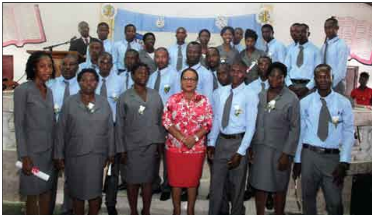
Graduation des Agents de Santé Communautaire (ASCP) de Plaisance du Sud (juillet 2015)

Dans le cadre de sa nouvelle politique de santé communautaire, le MSPP vise la formation d'un réseau unique de travailleurs de la santé, les Agents de Santé Communautaires Polyvalents (ASCP) . Ces agents sont formés suivant le curriculum standard élaboré par le MSPP et fournissent un paquet de services standard à la population. Ce programme prévoit la formation de plus de 10,000 ASCP pour les dix départements à raison d'un agent pour mille habitants ou 200 à 250 familles. Plus de 3,000 ASCP ont été formés en 2013-2014.