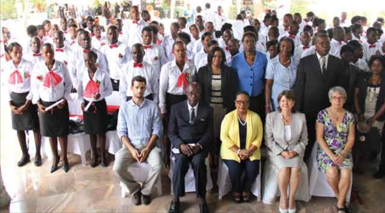
Graduation des Agents de Santé Communautaire Polyvalents aux Gonaïves (juillet 2015)

Au cours de l'année 2015, trois partenaires (Handicap International, Université Adventiste/ Université Loma Linda et l'hôpital Albert Schweitzer) impliqués dans les programmes de formation de Techniciens en Réadaptation se sont mis ensemble pour développer un programme standard de formation qui est en cours de validation au MSPP.