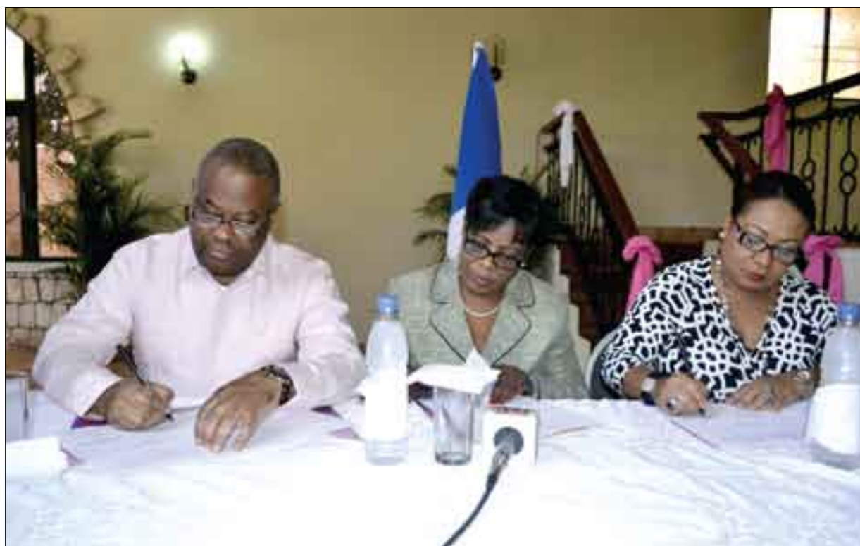
Signature du protocole d'accord relatif à la gestion du Bureau National de Lutte contre la Violence faite aux Femmes et aux Filles, mis en place par le Ministère à la Condition Féminine et aux Droits des Femmes (MCFDF)

Le dernier EMMUS paru rapporte que près de trois femmes sur dix (28%) ont déclaré avoir subi des violences physiques à un moment quelconque de leur vie depuis l'âge de 15 ans. Une femme sur dix a subi des actes de violence au cours des 12 derniers mois ayant précédé l'enquête. Cette proportion est plus élevée chez les femmes de moins de 25 ans. Au niveau des violences sexuelles, 13% des femmes haïtiennes ont subi des violences à un moment quelconque de leur existence.