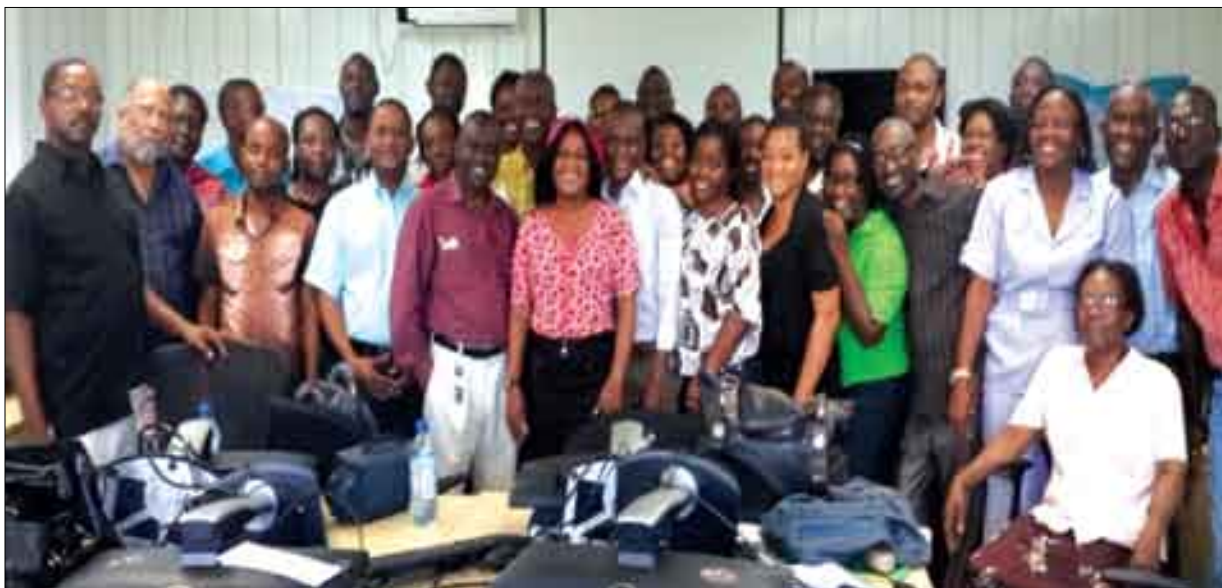
Formation des cadres du département sanitaire de la Grande-Anse sur le Financement basé sur les résultats

Dans le cadre de la gouvernance et du financement des services de santé, le secteur privilégie la contractualisation. Les résultats attendus du Financement Basé sur les Résultats (FBR) sont que : 1) l'amélioration des services de santé et en particulier ceux de la santé materno-infantile en équité et qualité soient améliorés ; 2) la motivation et la rétention du personnel surtout dans les zones rurales; 3) la participation des communautés dans le développement des stratégies, la mise en œuvre, la satisfaction du client/patient et la pérennité des acquis; 4) l'esprit d'innovation, d'initiative, d'entreprenariat et de responsabilité partagée ; 5) la rationalisation et l'efficacité des systèmes de gestion.