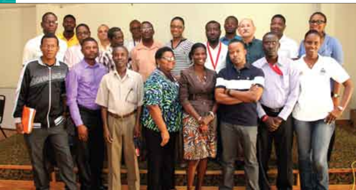
Participants à l'atelier sur la Finalisation des règlements internes de l'hôpital de campagne des maladies infectieuses (juin 2015)

Des normes techniques et administratives relatives à la prestation des services ainsi qu'à la gestion des ressources disponibles pour la santé ont aussi été élaborées, ou révisées pour certaines, et