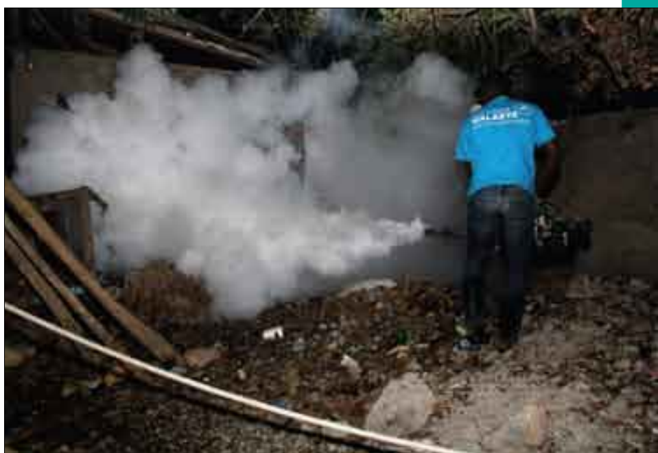
Séance de fumigation dans les localités à haut risque (Grande Anse, avril 2015)