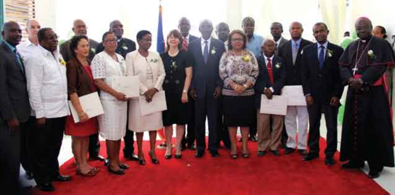
Installation du Conseil d'Administration de l'Hôpital la Providence des Gonaïves (mars 2015)

Pour les mêmes raisons évoquées antérieurement, depuis leur inauguration il y a plus d'un an, les trois HCR ( Hôpital Raoul Pierre-Louis d'Arcachon 32, Hôpital Ary Bordes de Beudet et l'Hôpital de Bon Repos ) construits dans le cadre de la coopération tripartite (Brésil, Cuba, Haïti) n'avaient pas pu atteindre dans un délai raisonnable leur niveau de fonctionnement optimal (24/24h, 7/7jr) . En vue d'apporter une solution à cette situation, le Ministère a organisé trois ateliers et des visites de supervision avec les responsables de ces institutions en vue d'identifier les principales contraintes et leur trouver des solutions. Le troisième atelier tenu au début de décembre 2015 a été l'occasion de faire le suivi des recommandations prises au cours des deux premiers en souhaitant que celles-ci puissent contribuer à atteindre les résultats escomptés le plus rapidement possible.