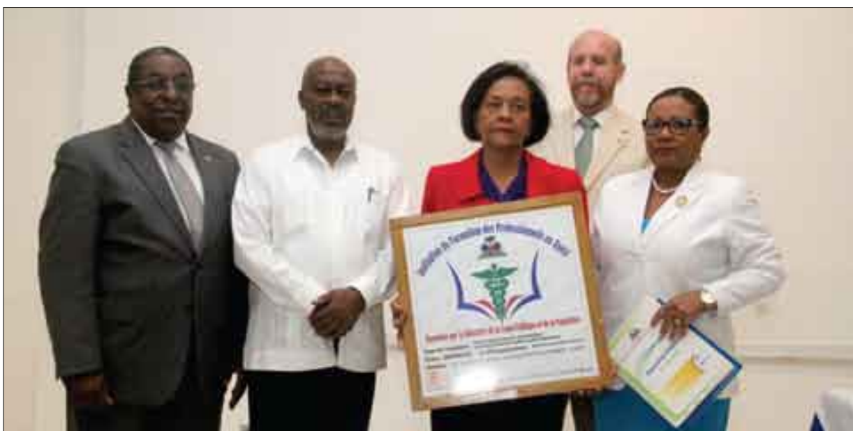
Cérémonie de remise de logo comme permis de fonctionnement aux écoles de formation d'infirmières privées (juin 2015)

Pour un meilleur contrôle des écoles de formation en Sciences Infirmières , le MSPP a créé un logo pour l'identification des institutions qui ont obtenu le permis de fonctionnement. A date, 55 institutions sont identifiées par ce logo du MSPP. La cérémonie de remise du logo a eu lieu le 11 juin 2015. Le Curriculum standard de Formation en Sciences Infirmières et le Manuel de Normes en Soins infirmiers ont été distribués aux représentants de ces institutions au cours de