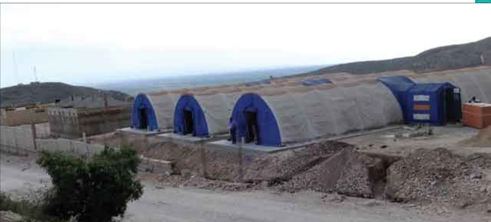
Centre de Traitement des Maladies Infectieuses (Morne à Cabrit)

Tenant compte de l'émergence de certaines maladies au niveau mondial, un centre de Traitement des Maladies Infectieuses est aussi en voie d'être établi au pied du Morne à Cabri permettant au