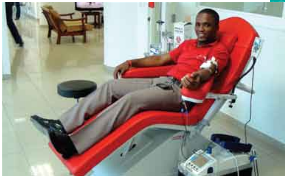
Un donneur volontaire

Afin d'augmenter l'accès aux produits sanguins, le MSPP à travers le PNST a établi 39 sites d'accès au sang avec l'ouverture de 25 dépôts de sang dont 3 ont été réactivés en 2014-2015. La couverture des demandes de sang au niveau national est de 54.74%.