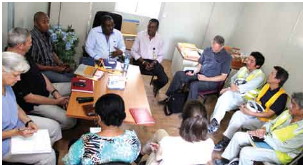
Visite de supervision de la Direction Générale du MSPP autour des partenaires contribuant à la construction de l'Hôpital St Michel de Jacmel (Coopération Japonaise et Croix Rouge Canadienne) (octobre 2015)

La Politique Nationale de Santé et le Plan Directeur en Santé accordent une place importante à la supervision dans le cadre du renforcement de la gouvernance du système de santé et de l'assurance de la qualité des soins et services. En plus des nombreuses supervisions normatives réalisées par les directions centrales au niveau des directions départementales et des principales structures de santé (institutions de tous les niveaux, cliniques dentaires, pharmacies, CDAI et autres), le niveau départemental réalise également des supervisions régulières au niveau des institutions. Ces supervisions portent sur la gestion des soins et services, le fonctionnement, l'accessibilité des services, la disponibilité et l'utilisation des procédures et protocoles de soins.