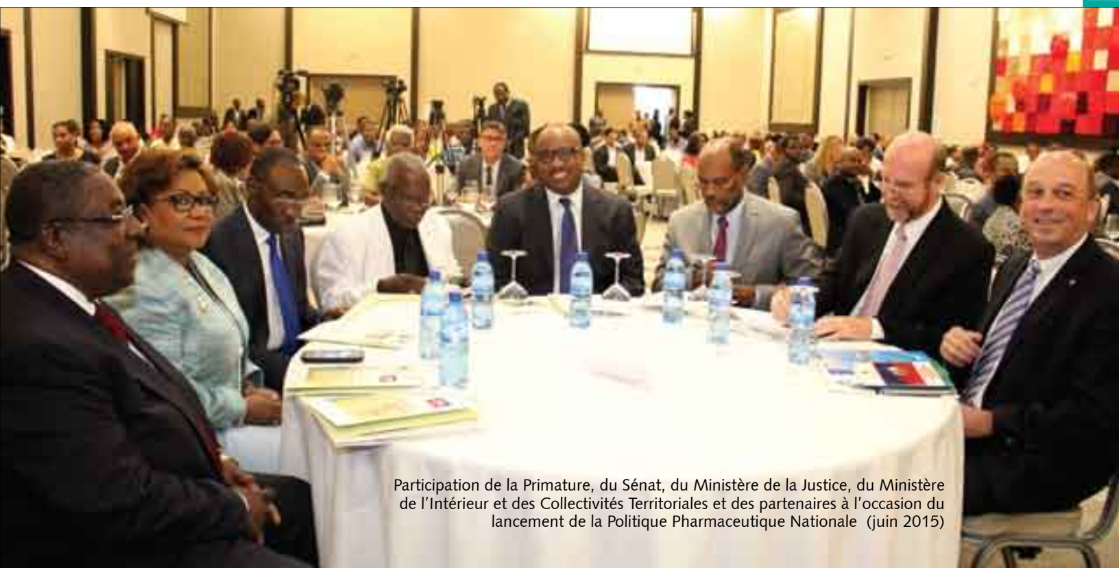
Participation de la Primature, du Sénat, du Ministère de la Justice, du Ministère de l'Intérieur et des Collectivités Territoriales et des partenaires à l'occasion du lancement de la Politique Pharmaceutique Nationale (juin 2015)

La Politique Nationale de Santé définit également les grandes lignes de gestion de l'intersectorialité en fixant les rôles et apports attendus des différents secteurs au renforcement du système