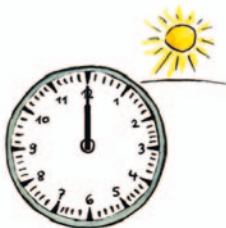
zwölf Uhr mittags