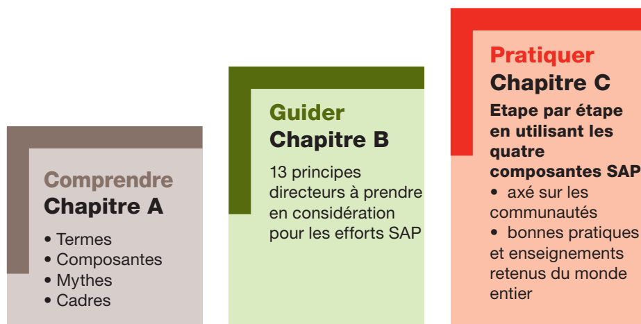
Figure 1 : Organisation de ce guide

Nous encourageons les spécialistes de RRC qui découvrent les systèmes d'alerte précoce à parcourir ce guide dans l'ordre proposé, afin de se familiariser avec les termes et les principes fondamentaux. Les lecteurs qui auront plus d'expérience dans le domaine pourront lire directement la liste des principes directeurs (Chapitre B) et passer plus rapidement au Chapitre C qui présente les aspects plus spécifiques des SAP et les exemples des différents pays par composante.