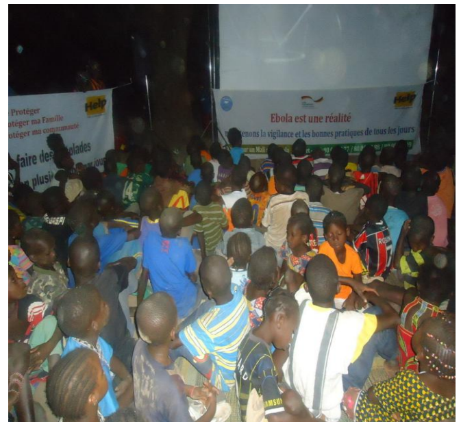
Poursuite de la campagne de sensibilisation de masse sur les mesures de prévention et de lutte contre cette maladie