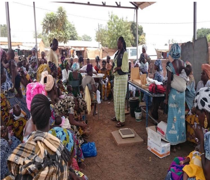
Séance d'information et de sensibilisation de 66 mamans sur les mesures prévention et de lutte contre la MVE au CSCOM de Narena (Kangaba)