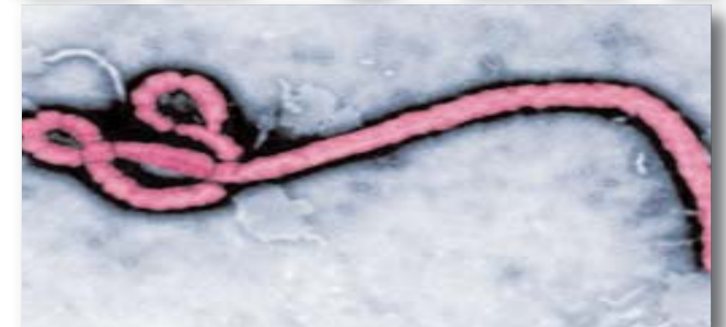
Virus Ebola vu au microscope électronique