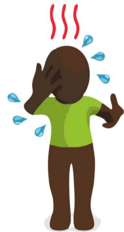
Febre e dor generalizada Fièvre et douleur généralisée

Os sintomas comuns são Les symptômes les plus courants sont :