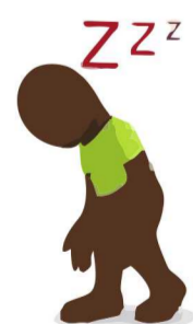
Fraqueza e mal estar Faiblesse et malaise