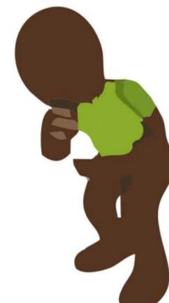
Dor de garganta Maux de gorge