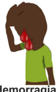
Hemorragia interna e/ou externa Hémorragie interne et / ou externe.