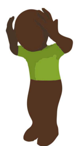
Dor de cabeça Maux de tête