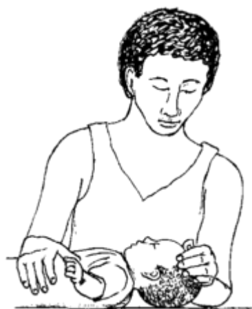
Hindi tulad nito.