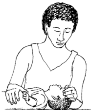
Dapat nakaharapnang diretsong pataasang sanggol, tulad nito.

2. Itaas nang bahagya ang baba niya, para nakaturo ito pataas nang kaunti, sa gawing kisame. Makakatulong ang paglagay ng maliit na binilot na tela sa ilalim ng balikat niya. Pananatilihin nitong bukas ang lalamunan niya para sa paghinga.