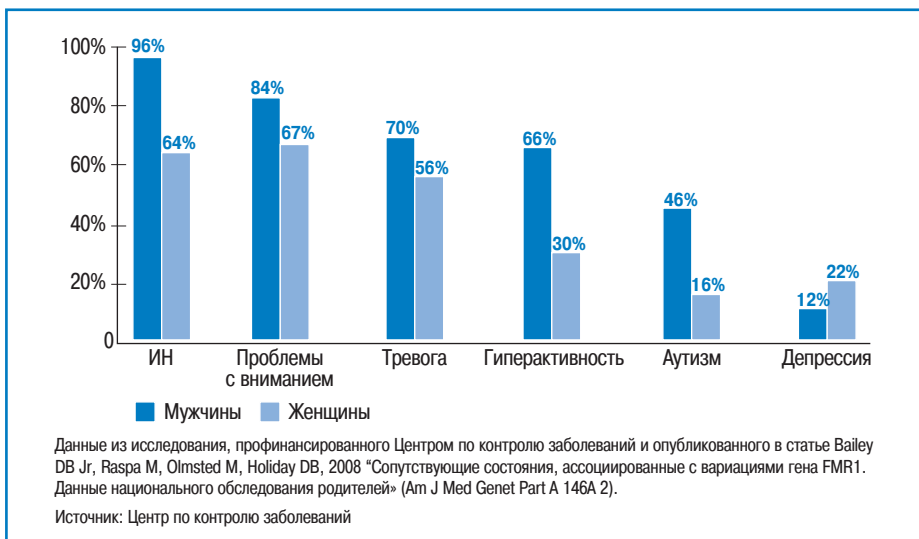
Рисунок С.1.2 Процент детей с хрупкой X-хромосомой диагностированных или пролеченных по поводу других заболеваний